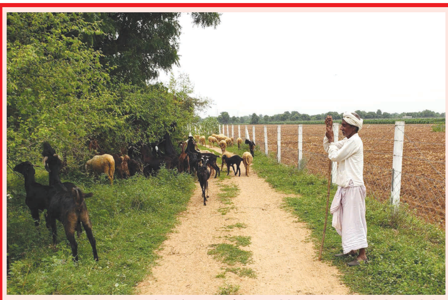
વરસાદ ખેંચાતા માલધારીઓની ચિંતા વધી ગઈ છે. પશુઓને ઘાસચારો મળવો મુશ્કેલ બન્યો છે. માલધારીઓને ઘાસચારા માટે પોતાના માલ ઢોર લઈને ઠેર ઠેર ભટકવું પડી રહ્યું છે. વરસાદ ખેંચાશે તો માલધારીઓએ વધુ કઠીન પરિસ્થિતિમાં મુકાવવું પડશે.

ગાંધીનગર, તા. ૧૦ અમદાવાદ બાપુનગર સ્થિત કર્ણાવતી હીરો બાઈક શો રૂમના લિંબડીયા ખાતે આવેલા ગોડાઉનમાં પતરાના શેડનું પતર ઉંચું કરીને ગોડાઉનમાં પ્રવેશી બારીના નટ બોલ્ટ કાઢી દરવાજાનું તાળુ તોડી અંદર રહેલા બાઈકમાંથી સ્વેલ્ડર બાઈકની ઉઠાંતરી થવા પામી છે. બનાવ અંગે ડબોડા પોલીસ મથકે રૂ.૪૮ હજારના બાઈક ચોરી અંગે ફરીયાદ નોંધાતા પોલીસે ચોર શાસોને પકડી પાડવા માટે ચક્રી ગતિમાન કર્યો છે.