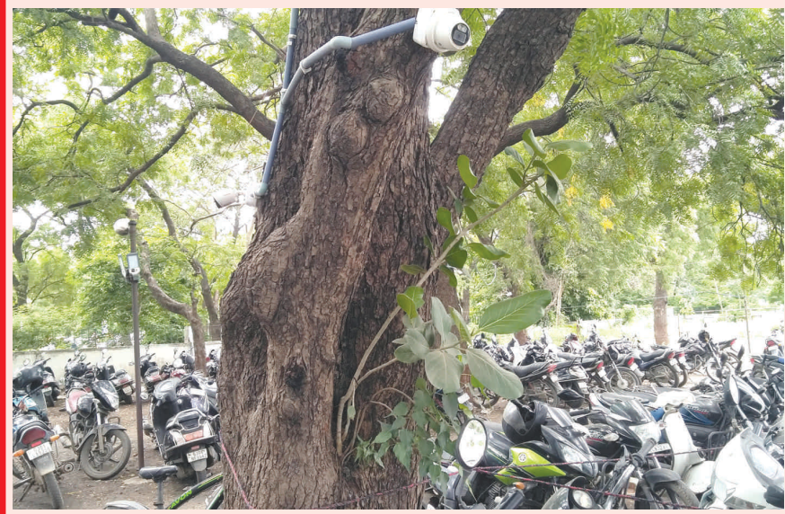
ક્યારે કુદરત અજબ લીલા આચરે છે. ગમે તેવી વિપરીત પરિસ્થિતિમાં વૃક્ષો પાંગરી શકે છે તે એસટી ડેપોમાં જોવા મળી રહ્યું છે. અહીં લીમડાના ઝાડ ઉપર વડ અને પીપળો ઉગેલો જોવા મળી રહ્યો છે. કુદરતની આ અજબ લીલા ભારે અચરજ ફેલાવી રહી છે.

એમ્બ્યુલન્સની લાંબી કતારો જોવા મળતી હતી. કેટલાક નાગરીકોએ ઓકિસજન તેમજ સારવાર સમયસર ના મળતા એમ્બ્યુલન્સમાં આમરી શ્વાસ લીધા હતા. ઓકિસજનના સિલીન્ડર લેવા માટે નાગરીકો રીતસરની દોડધામ કરી હતી. ત્યારે હાલ પણ નાગરીકોને સામાન્ય તાવ કે શરદી-ખાંસી હોય તો આરટીપીસીઆર ટેસ્ટ કરાવે છે. ગાંધીનગર શહેર-ગ્રામ્ય વિસ્તારમાં છેલ્લા અઠવાડીયામાં ૫૧ ૩૨ વ્યક્તિના કોરોના ટેસ્ટ કરવામાં આવ્યા હતા. ગાંધીનગર મેડીકલ કોલેજ લેબ ખાતે તમામ સેમ્પલના ટેસ્ટ થયા હતા. પરંતુ આટલી મોટી સંખ્યામાં ટેસ્ટ કરવા છતાં માત્ર એક જ કોરોના પોઝીટીવ કેસ સામે આવ્યો હતો. જેથી કોરોના કેસની સંખ્યામાં ધરમધ ઘટાડો નોંધાતા આરોગ્ય તંત્રએ રાહતની લાગણી અનુભવે છે.