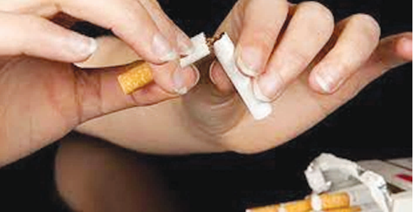
છોકરા છોકરીઓ બંને મોજ-શોખ માણવા માટે નશીલા પદાર્થોનું સેવન કરી રહ્યા છે. ઈન્ફોર્સિટી અને રિલાયન્સ સર્કલ વિસ્તારમાં છોકરીઓ ખુલ્લેઆમ

મોજ-શોખ દરમિયાન યુવાનો દ્વારા દારૂ સહિત વિવિધ પીણાંઓનું સેવન થઈ રહ્યું છે. નશાની ટુનિયા તમારા ઘરથી દૂર હશે પણ એ નશો કરનાર શું તમારા દીકરા કે દીકરીઓ તો નથી ને? જે મિત્રો સાથે પાર્ટીમાં કે ફરવા જતા હોય તેનું ખાસ ધ્યાન રાખવું. જેમ દગો કોઈનો સગો નહીં એમ જ નશો અને નશો કરનાર વ્યક્તિ કોઈનો સગો નહીં એવું ચોકકસ કહી શકાય. નશાની આ લત ભાવિ પેઢીની દિશા અને દશા બદલી નાખશે. તેના માટે સામાજિક જાગૃતિ, પારીવારિક દરકાર અને યુવાનોમાં સાચી સમજણના બીજ રોપાય તો જ વધતી જતી નશાની બદીને અટકાવી શકાશે.