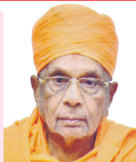
શાસ્ત્રી શ્રી હરિપ્રકાશદાસ સ્વામિનારાયણ ગુરુકુલ, સે. ૨૨/૨૩