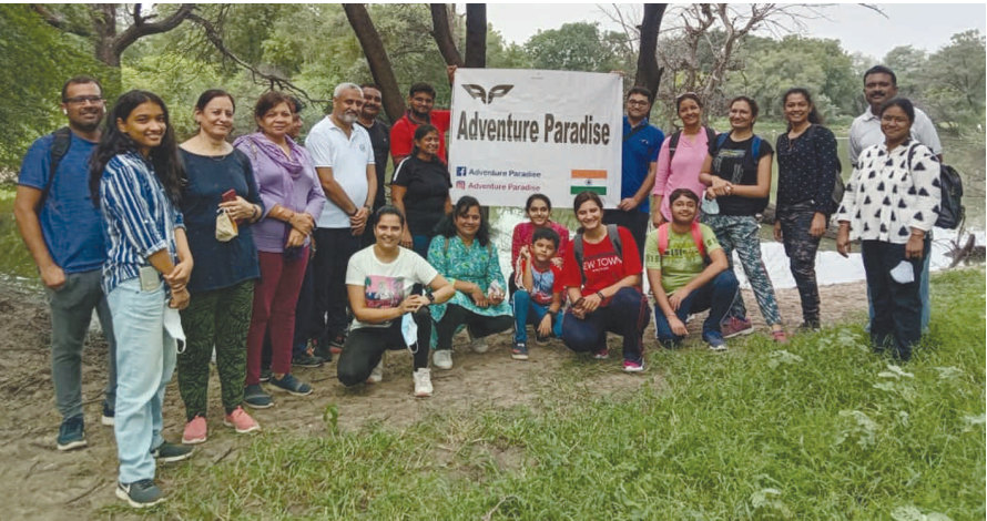
એડવેન્ચર પેરેડાઈસ સંસ્થા દ્વારા નગરમાં મોર્નિંગ ટ્રેકિંગ આયોજન કરવામાં આવ્યું હતું. સંસ્થા દ્વારા કોરોના ગાઈડલાઈનના અમલ સાથે ટ્રેકિંગ, યોગા, ગ્રુપ ડીસ્કશન તેમજ નવા રોપાઓનું વિતરણ કરવાનો કાર્યક્રમ યોજવામાં આવ્યો હતો. નગરના યુવાનોમાં પ્રકૃતિ પ્રેમ વધે તેમજ પર્યાવરણ અંગેની જાગૃતિ કેળવવા તેવા ઉમદા આશય સાથે સંસ્થા દ્વારા આ પ્રકારના કાર્યક્રમનું સમર્થન આયોજન કરવામાં આવે છે.

વર્ષની મર્યાદા અપવામાં આવી શકે છે. ઉલ્લેખનિય છે કે રાજ્યમાં ૨૦ વર્ષ બાદ વાહનોને સ્કેપ કરવાની પોલિસી અંગે વિચારણા હાથ ધરાઈ છે જે આવતી કાલે ગાંધીનગરથી જાહેર થનાર છે.