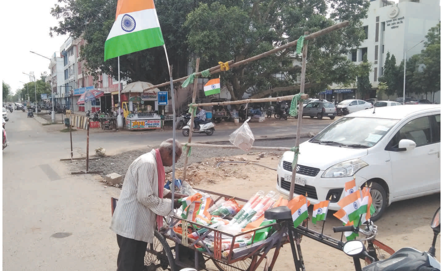
સ્વાતંત્ર્ય દિવસ નજીક આવે એટલે દેશભક્તિનો જાણે ઉભરો આવે છે. સોશિયલ મીડીયામાં જાતભાતના દેશભક્તિના કવોટસ ઠલવાય છે. ત્રણ ચાર દિવસ સુધી દેશભક્તિની લહેર જોરદાર ચાલે છે. ઠેર ઠેર રાષ્ટ્રધ્વજ વેચાતા જોવા મળે છે. રાષ્ટ્રપ્રેમની આ લહેરનો ફાયદો ઉઠાવતા હોય તેમ ફેરીયાઓ ઠેર ઠેર રાષ્ટ્રધ્વજ લઈને બેસી ગયા છે. સેક્ટર-૧૯ માં નાગરિક બેંકની બાજુમાં લારીમાં રાષ્ટ્રધ્વજ વેચાઈ રહ્યા છે.

આવી જતા નાના મોટા અકસ્માત પણ સર્જતા નાગરીકો ઘાયલ પણ થાય છે. તંત્ર સમક્ષ રજૂઆત કરવા છતાં લાઈટો શરૂ ન થતા વસાહતીઓને ચોરીનો ભય સતાવી રહ્યો છે. જ્યારે અંધકાર હોવાથી નાના બાળકો કે મહિલા શોપીંગ સેન્ટર સુધી પણ જતા ડર અનુભવે છે. ત્યારે સેક્ટર-૨૯ ના આંતરીક માર્ગની લાઈટો તાત્કાલીક અસરથી શરૂ કરવામાં આવે તેવી નાગરીકોની લાગણી અને માંગણી છે.