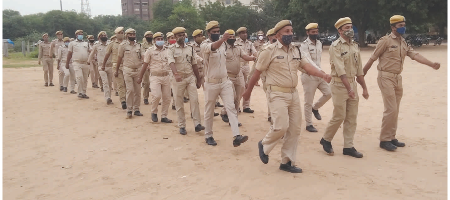
સેક્ટર-૧૧ ના રામકથા મેદાન ખાતે હાલમાં ચહલપહલ જોવા મળી રહી છે. રામકથા મેદાનમાં સ્વાતંત્ર્ય દિવસની ઉજવણીના ભાગરૂપે પરેડનું રીહસલ થઈ રહ્યું છે. હોમગાર્ડના જવાનો અહીં પરેડ કરી રહ્યા છે. જે આકર્ષણનું કેન્દ્ર બન્યા છે.

સંકુલમાં પાર્કિંગ માટે જગ્યા ન હોવાથી તેઓએ પોતાની ઝેન કાર નં. જી.જે.૦૧.એચ.સી.-૩૪૦૪ એમ.એસ.બિલ્ડીંગની પાછળના ભાગે પાર્ક કરી હતી. બપોરના બે વાગ્યાના અરસામાં મીટીંગ પૂરી થઈ જતા તેઓ કાર પાર્ક કરી હતી તે સ્થળ પર આવ્યા હતા. પરંતુ પાર્ક કરેલી જગ્યા પર કાર ન હતી. જેથી શહેરના માગો તેમજ આસપાસના રસ્તાઓ પર તપાસ-શોધમોળ આદરી હતી.