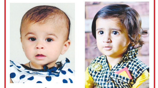
આરાધ્યા આશિષકુમાર દરજી સાઈબા, તા. ઘાચડ જેનિલ રોહીતકુમાર દરજી ઘાચડ, જિ. અરવલ્લી