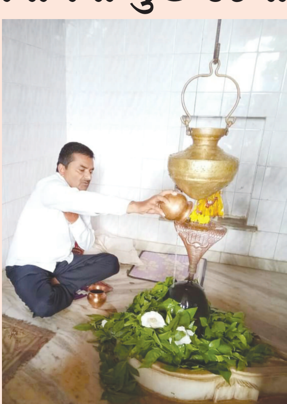
કિર્તન, આખ્યાન, યજ્ઞ જેવા ધાર્મિક કાર્યક્રમોનું શ્રદ્ધાળુ ભક્તો દ્વારા આયોજન કરવામાં આવી રહ્યું છે.

રાયગઢ, તા. ૨૬ હિંમતનગર તાલુકાના ગ્રામ્ય વિસ્તારોમાં પવિત્ર શ્રાવણ માસે શિવ મંદિરોમાં પૂજન-અર્ચન કરવા શ્રદ્ધાળુ ભક્તોની ભીડ જામી રહી છે. શિવ મંદિરોમાં ઓમ નમઃ શિવાયના નાદથી ગુંજી ઉઠયા છે. ગાંભોઈ પંથકના રૂપાલના છાત્રીસા તળાવ કાંઠે છત્રેશ્વર મહાદેવ, ગાંભોઈ કરણપુરના કરણેશ્વર શિવમંદિર, હાથરોલ પાસે લીલી વનરાજી વચ્ચે ઘેરાયેલું ચૌમુખ મહાદેવ મંદિર, કંટાળેશ્વર મહાદેવ બેરણા, રાયગઢમાં વૈજનાથ શિવ મંદિર તેમજ ખેડ, સુરજપુરા, પીપલીયા, નિકોડા, પેઢમાલા, મહાદેવપુરા વગેરે ગામોના શિવાલયોમાં હર હર મહાદેવના નાદથી ગુંજી ઉઠયા છે. શ્રદ્ધાળુ ભક્તો દ્વારા ભિલીપનો ચઢાવી શિવ મંદિરોમાં જળાભિષેક, રુદ્રાભિષેક તેમજ શિવ મહિમાનો પાઠ કરાવી ગંગાધરના પવિત્ર દર્શન કરી ઓમ નમઃ શિવાયના નાદ સાથે શ્રદ્ધાળુ ભક્તો પૂજન-અર્ચન કરી રહ્યા છે. આ પવિત્ર શ્રાવણ નિમિત્તે વિવિધ ગ્રામ્ય શિવમંદિરોમાં ભજન-