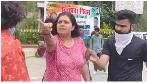
પર આવ્યા ત્યારે આ ઘટના બની હતી. ફરજપરના સ્ટાફે

લખેલી કાર લઈને પ્રવેશતી વખતે બ્રાહ્મડયા બનાવ દરમિયાન પુરુષ સભ્યો પણ ઉશ્કેરાયેલા જોવા મળ્યા હતા અને તેમણે ટોલ કર્મી સાથે ઝપાઝપી કરી હતી. આ ઘટનાની તમામ વિડીયોગ્રાફી ફરજપરના કેટલાક કર્મીઓએ સોશિયલ મીડિયામાં વાઈરલ કરતા ફરજપરની પોલીસ પણ ઘટના સ્થળે આવી ગઈ હતી. માઉન્ટ આબુ પોલીસના ટેવેન્ડ્ર સિંહે ઘટનાસ્થળે પહોંચીને હુમલો કરનાર ચાર પુરુષો અને ત્રણ મહિલાઓને શાંતિ ભંગ કરવાના આરોપસર અટકાયતી પગલાં લીધા હતા. નગરપાલિકાના કર્મચારીઓએ સમગ્ર બાબત અંગે માઉન્ટ આબુ પોલીસ સ્ટેશનમાં ફરિયાદ આપી છે.