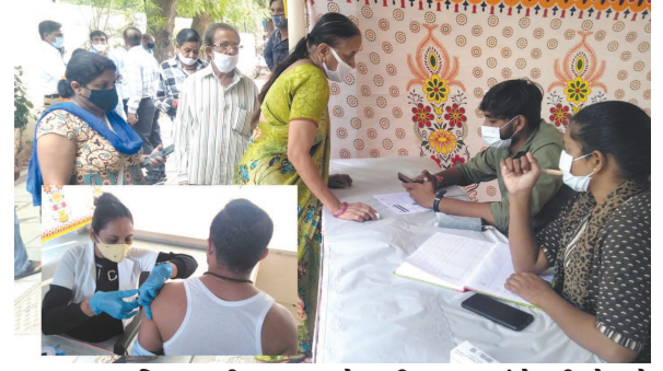
જુના સચિવાલયની પાછળ આવેલા મીનાબજારમાં વેપારીઓ માટે કોરોના રસીકરણ કેમ્પનું આયોજન કરવામાં આવ્યું હતું. મોટી સંખ્યામાં વેપારીઓએ તેનો લાભ લીધો હતો.

વિદાય નિશ્ચિત... ● અનુસંધાન પહેલાનું ચાલુ સીએમ બનાવવા હતા પણ હવે એવું કહેવાઈ રહ્યું છે કે, ભૂપેશ બધેલ અને ડીએસ સિંહ દેવ વચ્ચે સીએમ પદ અદી-અદી વર્ષ વહેંચવાનું નક્કી થયું હતું. જોકે