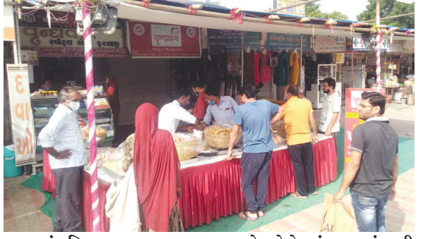
પાંચ દિવસ ચાલતા સાતમ આઠમના તહેવારોનો પ્રારંભ નાગપાંચમથી થાય છે. નાગપાંચમે ખાજાની ખરીદી કરવામાં આવે છે. ફરસાણની ઢુકાનોમાં નાગપાંચમે ગળ્યા, મોળા અને તીખા ખાજાનું ધૂમ વેચાણ થયું હતું. સારી એવી ધરાકી જોવા મળી હતી.