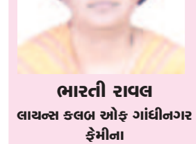
ભારતી રાવલ લાયન્સ કલબ ઓફ ગાંધીનગર ફેમીના