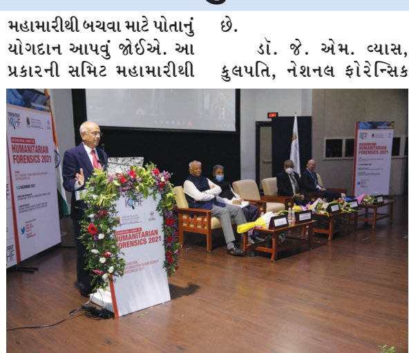
બચાવ અંગેની ગાઈડલાઈન્સ આપીને માનવસેવાનું કાર્ય કરે

ગાંધીનગર, તા. ૧ આજે ગાંધીનગર ખાતેની નેશનલ ફોરેન્સિક સાયન્સ યુનિવર્સિટી ખાતે 'હ્યુમેટેરિયન ફોરેન્સિક્સ-૨૦૨૧' વિષયે ત્રીજી આંતરરાષ્ટ્રીય સમિટનું ઉદઘાટન કરાયું હતું. આ પ્રસંગે ગુજરાત રાજ્ય માનવ અધિકાર પંચના અધ્યક્ષ નિવૃત્ત ન્યાયાધીશ રવિકુમાર ત્રિપાઠી, એન.એ.એસ.યુ.ના કુલપતિ ડૉ. જે.એમ.વ્યાસ, નવી દિલ્હીથી એહોર્ડ ઈન્ટરનેશનલ કમિટી ઓફ ધરેડકોસના જૈન મિસ્ટ્રીક ઉપસ્થિત રહ્યા હતા. બે દિવસીય આ સમિટનું ગુરુવારે સમાપન થશે.