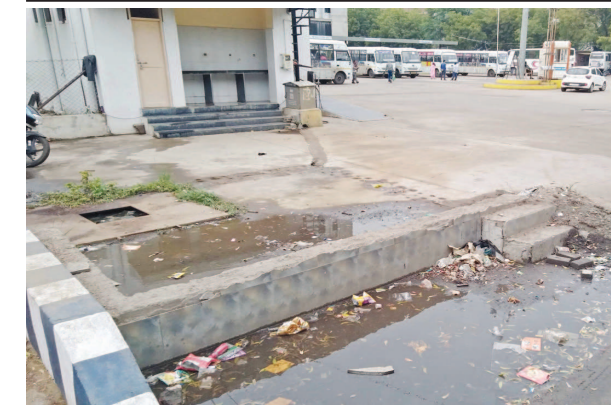
યોગી સીટી બસ સ્ટેન્ડની બાજુમાં પાણીની પરબ પાસે ગંદકીના દેશ્યો સર્જ્યા છે. જ્યાં ગટરનું ઢાંકણ પણ નથી જેથી દુર્ગંધ ફેલાઈ રહી છે અને પાણી ઉભરાઈને રોડ નજીક ભરાઈ રહ્યું છે.

સિલ્વર મેડલ્સ મેળવવામાં સફળ રહ્યા હતા. આ ઉપરાંત કાતા ઈવેન્ટમાં પણ ૫ ખેલાડીઓએ ગોલ્ડ મેડલ તથા ૮ ખેલાડીઓએ સિલ્વર મેડલ મેળવ્યો હતો. ૧૩ જેટલા ખેલાડીઓ સેમીફાઈનલ સુધી પહોંચ્યા હતા. વાડોકાઈ કરાટે ડો ફેડરેશન ઓફ ઈન્ડિયાનાં ગાંધીનગરનાં