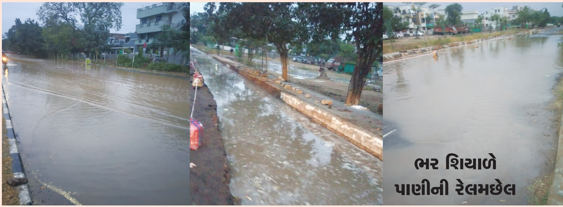
ભર શિયાળે પાણીની રેલમછેલ

ખ-૭ માર્ગ પર જાણે વરસાદનું પાણી ભરાઈ ગયું હોય તેવા દેશ્યો સર્જ્યા છે. આખા વિસ્તારમાં માર્ગની આસપાસ પાણી ભરાયું છે. જો કે આ પાણી વરસાદનું નહીં પણ પાણીની પાઈપલાઈન તૂટવાથી ભરાયું છે. ત્યાંના વસાહતીઓને સવારના સમયે આ દેશ્યો જોતા જ એવી લાગણી પ્રસરી કે જાણે ખૂબ વરસાદ વરસ્યો હોય અને પાણી ભરાઈ ગયું હોય પરંતુ સ્થળ પર જઈને તપાસ કરતા જાણવા મળ્યું હતું કે પાણીની પાઈપ લાઈન લીકેજ થવાથી આટલું બધું પાણી ભરાયું છે. માર્ગની આસપાસ ખોદકામ થવાના કારણે ખાડાઓમાં પણ પાણી ભરાયા છે.