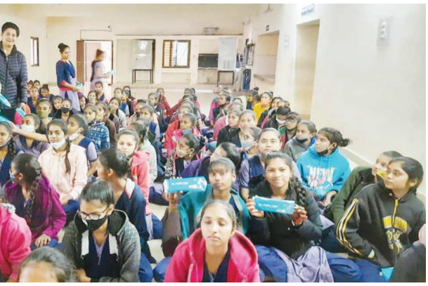
અંતર્ગત સંસ્થાની ટિકરીને ન પડે અને આર્થિક ભર્ય ન કરવો પ્રતિમાસ આ સુવિધા મળતી રહે

થકી દ્વિતીય પરમેનન્ટ પ્રોજેક્ટ કાર્યરત કરાયો. આ પ્રોજેક્ટ સેનેટરી નેપકીન ખરીદવા બહાર ન જવું પડે કે બહારથી મંગાવવા પડે તે માટે રોટરી ક્લબ ઓફ કેપિટલ, ગાંધીનગર દ્વારા