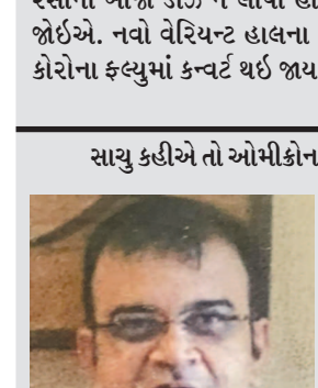
ડૉ ગિલન મહિયાર

કણાટકમાં ઓમિકોનના બે કેસ નોંધાયા પછી વધુ ચિંતા કરવાની કોઈ જ જરૂરિયાત નથી, પરંતુ શહેરીજનોએ સાવધાની રાખવી જોઈએ. માસ્ક પહેરવુ જોઈએ અને પહેલાની જેમ સોશયલ ડિસ્ટન્સિંગ તેમજ અન્ય ઉપાય અપનાવવાનો પ્રારંભ કરી દેવો જોઈએ. તે ઉપરાંત જે નગરજનોએ હજુ સુધી વેકિસન નથી લીધી તેઓએ તુરંત પહેલા વેકિસન લેવી જરૂરી છે. હાલ ગભરાવવાની જરૂર નથી પણ સાવધાની એટલી જ જરૂરી છે. સાવધાની અચૂક રાખવી જોઈએ. દિવાળી બાદ માસ્ક અને સોશિયલ ડિસ્ટન્સીંગનો અમલ થયો છે જે ગંભીર છે.