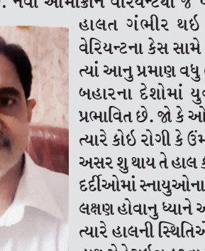
ડૉ ગિલન મહિયાર

કણાટકમાં ઓમિકોનના બે કેસ નોંધાયા પછી વધુ ચિંતા કરવાની કોઈ જ જરૂરિયાત નથી, પરંતુ શહેરીજનોએ સાવધાની રાખવી જોઈએ. માસ્ક પહેરવુ જોઈએ અને પહેલાની જેમ સોશયલ ડિસ્ટન્સિંગ તેમજ અન્ય ઉપાય અપનાવવાનો પ્રારંભ કરી દેવો જોઈએ. તે ઉપરાંત જે નગરજનોએ હજુ સુધી વેકિસન નથી લીધી તેઓએ તુરંત પહેલા વેકિસન લેવી જરૂરી છે. હાલ ગભરાવવાની જરૂર નથી પણ સાવધાની એટલી જ જરૂરી છે. સાવધાની અચૂક રાખવી જોઈએ. દિવાળી બાદ માસ્ક અને સોશિયલ ડિસ્ટન્સીંગનો અમલ થયો છે જે ગંભીર છે.