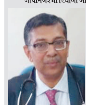
ડૉ ધર્શન પંડ્યા

જુના વેરિયન્ટના નવા ઓમિકોન વેરિયન્ટથી જે પણ દર્દી સંક્રમિત થયા છે તેમની હાલત ગંભીર થઈ નથી. ઘણાં બધા દેશોમાં આ વેરિયન્ટના કેસ સામે આવ્યા છે. વેકિસન લીધી ન હોય ત્યાં આનુ પ્રમાણ વધુ હોવાનુ પણ ધ્યાને આવ્યુ છે. હાલ બહારના દેશોમાં યુવા દર્દીઓ પણ આ વેરિયન્ટથી પ્રભાવિત છે. જો કે ઓમિકોન ઘાતકી પુરવાર થયો નથી. ત્યારે કોઈ રોગી કે ઉમરલાયક વ્યક્તિને આ વેરિયન્ટની અસર શુ થાય તે હાલ કહેવુ મુશ્કેલ છે. પરંતુ ઓમિકોનના દર્દીઓમાં સ્નાયુઓના દુખાવાની ફરિયાદ પણ એક મુખ્ય લક્ષણ હોવાનુ ધ્યાને આવ્યુ છે. ઘણાંને તાવ આવતો નથી ત્યારે હાલની સ્થિતિએ અત્યાર માટે માસ્ક પહેરવા સાથે હાથ સેનેટાઈઝ કરવા અને દુરી બનાવી રાખવી સહીતના