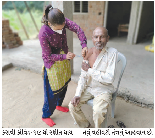
કરાવી કોવિડ-૧૯ થી રક્ષિત થાય તેવું વહીવટી તંત્રનું આહવાન છે.