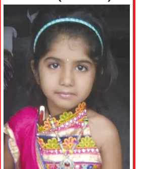
આસ્તા ભારકરભાઈ પટેલ શાંતિકુંવર સોસાયટી બાયડ જીલ્લા અરવલ્લી