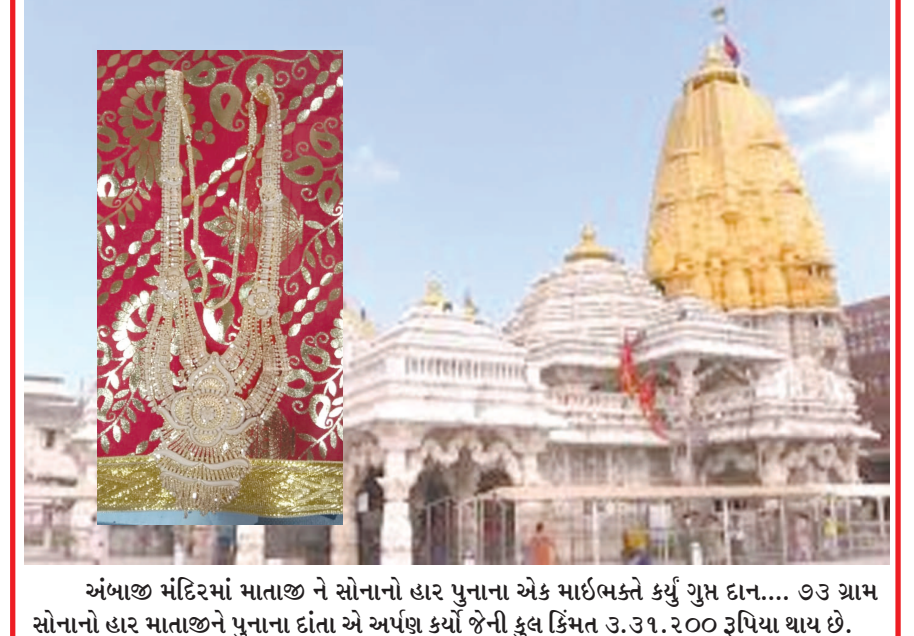
અંબાજી મંદિરમાં માતાજી ને સોનાનો હાર પુનાના એક માર્શલકે કર્યું ગુપ્ત દાન... ૭૩ ગ્રામ સોનાનો હાર માતાજીને પુનાના દાંતા એ અર્પણ કર્યો જેની કુલ કિંમત ૩.૩૧.૨૦૦ રૂપિયા થાય છે.