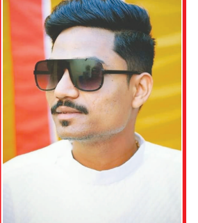
મોત બારોટ બાયડ