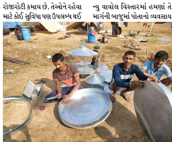
રોજરોટી કમાય છે. તેઓને રહેવા માટે કોઈ સુવિધા પણ ઉપલબ્ધ થઈ નથી. આવી કડકડતી ઠંડીમાં પણ તેઓ ખુલ્લા મેદાનો, ખેતરોમાં આશરો લઈને ધંધો કરી રહ્યા છે.

રાજસ્થાનથી આવેલા ગાડલીયા લુહાર પરિવારના સભ્યો ગેલ્વેનાઈઝમાંથી વિવિધ ચીજવસ્તુઓ બનાવી રહ્યા છે જેમાં ચબુતરા, ચૂલા, ખાટીનું કૂકર, સગડી વિગેરે... મહેસાણામાંથી ગેલ્વેનાઈઝના પતરા ખરીદીને લાવે છે જેનો ભાવ ૧ કિલો પેટે ૧૨૦ રૂપિયા છે. આ પતરામાંથી વિવિધ આકારો આપીને સુંદર મજાના ચબુતરા તથા અન્ય સામગ્રીઓ બનાવે છે. એક ચબુતરો બનાવતા લગભગ ૪થી ૫ કલાક જેટલો સમય લાગી જાય છે. એક ફૂટથી પાંચ ફૂટ સુધીના ચબુતરા તેઓ બનાવી આપે છે. ગ્રાહકોને જોઈએ તે પ્રમાણેના ચબુતરાની બનાવટ કરી આપે છે. આ પરિવાર ચાર પાંચ વર્ષથી ગુજરાતમાં ધંધાથી તરીકે આવે છે. જેમાં કુલ પંદરેક સભ્યો છે. તમામ પરિવારના સભ્યો સવારથી સાંજ ખૂબ મહેનત કરીને ચીજવસ્તુઓ બનાવે છે અને