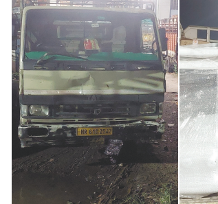
મોડાસા, તા. ૧૨ ગ્રામ પંચાયતની ચૂંટણીઓને ગણતરીના દિવસો બાકી રહ્યા છે ત્યારે મુખિયા બનવા ઉમેદવારો શામ, દામ અને દંડની નીતિ અપનાવી રહ્યા છે દેશી-વિદેશી ઢાડની રેલમછેલ કરી મતદારોને રીઝવવા સ્થાનિક બુટલેગરો સાથે ગોઠવણ કરી વિદેશી ઢાડ સંગ્રહ કરી રહ્યા છે અરવલ્લી જિલ્લા પોલીસતંત્રે દેશી-વિદેશી

શામળાજી નજીક ટ્રકમાંથી ૬.૮૦ લાખનો ઢાડ ઝડપ્યો