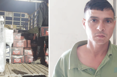
મોડાસા, તા. ૧૨ ગ્રામ પંચાયતની ચૂંટણીઓને ગણતરીના દિવસો બાકી રહ્યા છે ત્યારે મુખિયા બનવા ઉમેદવારો શામ, દામ અને દંડની નીતિ અપનાવી રહ્યા છે દેશી-વિદેશી ઢાડની રેલમછેલ કરી મતદારોને રીઝવવા સ્થાનિક બુટલેગરો સાથે ગોઠવણ કરી વિદેશી ઢાડ સંગ્રહ કરી રહ્યા છે અરવલ્લી જિલ્લા પોલીસતંત્રે દેશી-વિદેશી