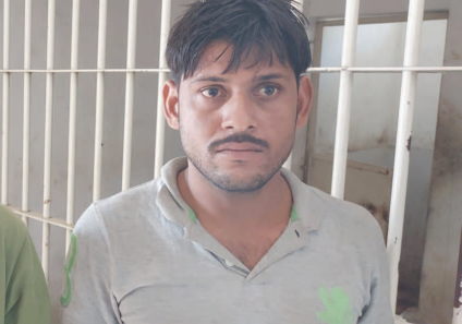
મોડાસા, તા. ૧૨ ગ્રામ પંચાયતની ચૂંટણીઓને ગણતરીના દિવસો બાકી રહ્યા છે ત્યારે મુખિયા બનવા ઉમેદવારો શામ, દામ અને દંડની નીતિ અપનાવી રહ્યા છે દેશી-વિદેશી ઢાડની રેલમછેલ કરી મતદારોને રીઝવવા સ્થાનિક બુટલેગરો સાથે ગોઠવણ કરી વિદેશી ઢાડ સંગ્રહ કરી રહ્યા છે અરવલ્લી જિલ્લા પોલીસતંત્રે દેશી-વિદેશી