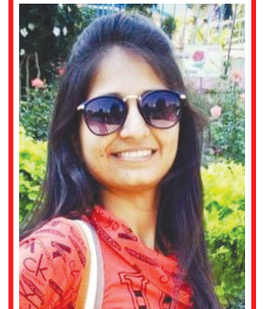
આયુષી ડો. રવીન્દ્રભાઈ પટેલ સ્વામિનારાયણ સોસાયટી વિભાગ-૨ બાયડ, જુલો અરવલ્લી