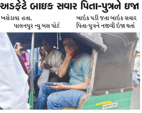
બાઈક સવાર પિતા-પુત્રને ઈજા થતા તેઓને સારવાર અર્થે સામે ટ્રાફિક જામ વચ્ચે કોઈ અજાણ્યા વાહનની અડફેટે

અખાયા વાહનની અડફેટે બાઈક સવાર પિતા-પુત્રને ઘણા પાલનપુર તા. ૧૨ અસેડાયા હતા. બાઈક પડી જતા બાઈક સવાર પાલનપુરમાં ટ્રાફિકની પાલનપુર ન્યુ બસ પોર્ટ પિતા-પુત્રને નજવી ઈજા થતાં વકરતી જતી સમસ્યા વચ્ચે ઇશવારે વાહન ચાલકો વચ્ચે નજવી તકરાર થવાની સાથે નજવા અકસ્માતો પણ બનતા રહે છે. ત્યારે ન્યુ બસ પોર્ટ સામે એક અજાણ્યા વાહનની અડફેટે