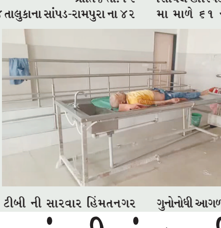
ગુનોનોષી આગળ ની કાયદેસર ની કાર્યવાહી હાથ ધરી હતી.