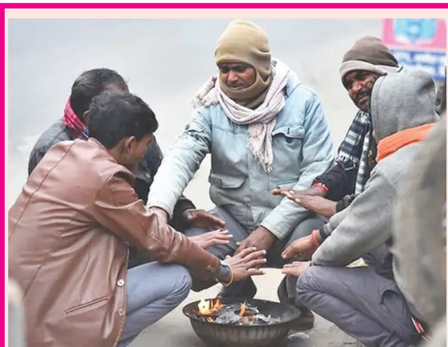
માઉન્ટઆબુના રસ્તાઓ પર બરફની ચાદર... કોરોનાના કેસ ઘટતા હાલમાં હીલ સ્ટેશન માઉન્ટ આબુમાં પ્રવાસીઓની સંખ્યામાં વધારો થયો છે. ખાસ કરીને કપલોની સંખ્યા વધી છે. બીજીતરફ આબુમાં ઠંડીનો પારો દિન-પ્રતિદિન ગગડી રહ્યો છે. માઉન્ટ આબુમાં ગઈકાલે તાપમાન ૦ ડિગ્રી હતું. જેના કારણે અનેક રસ્તાઓ, ઝાડ તેમજ વાહનો પર બરફના પડ જામી ગયા હતા. જેના કારણે લોકો વહેલીવારે આબુમાં રસ્તાઓ પર બરફની ચાદર પર મોજમસ્તી તેમજ ફોટોગ્રાફી કરતા જોવા મળ્યા હતા.

પૈસા ખર્ચીને પેપર મેળવી અનેક બેરોજગારો નોકરી મેળવી રહ્યા છે. જિલ્લામાં અગાઉના વર્ષોમાં ત્રણ જેટલા પેપર લીક કરવાની ઘટના પછી પણ માત્ર તપાસના નામે નોટંકી થતી આવી છે. કોબાંડીઆઓને બચાવવા માટે તેમના આકાઓ તૈયાર હોય છે. પેપર લીક થાય તેવા તપાસ કરાવીશું તેવા નિવેદનો થાય અને ત્યાર પછી તપાસ કમીટી બનાવવામાં આવે અને પછી દિવસો મહિનાઓ પસાર થઈ જાય અને બધું ભુલી જવાય છે. ગુજરાત ગૌણ સેવા પસંદગી મંડળ દ્વારા આયોજિત પેપર ફટવાની ઘટનાઓથી સરકાર અને ગૌણ સેવા પસંદગી મંડળની કાર્યપ્રણાલી ઉપર ખુલ્લેઆમ આંગળી ચિંધાઈ રહી છે ત્યારે રાજકીય પક્ષના કાર્યકર્તા દ્વારા પ્રાંતિજ નગરના એક ફાર્મ હાઉસમાં પેપર લીક થયાનું ઠાવો કર્યો છે અને તેમાં ૧૬ ઉમેદવારોને લાખો રૂપિયામાં પેપર વેચવામાં આવ્યાનો ઠાવો કર્યો છે. પેપર સોલ માટે એક નિરીક્ષક પણ ફાર્મ હાઉસમાં હાજર હોવાના ઠાવો સાથે સિસ્ટમ ઉપર આંગળી ચિંધાઈ છે. રાજકીય પક્ષના કાર્યકર્તા ઠાવો કર્યો છે કે તેની પાસે પેપર લીક થયા અંગેના પુરાવા છે અને તેમાં એક પોલીસ કોન્સ્ટેબલની સંવહણી હોવાનો આરોપ લગાવ્યો છે.