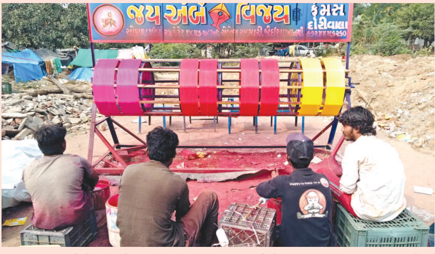
ગુજરાતીઓનો પ્રિય તહેવાર ઉત્તરાયણ નજીક આવી રહ્યો છે. ઉત્તરાયણ નજીક આવતા બજારોમાં પતંગ-દોરીનો વ્યવસાય શરૂ થઈ ચૂક્યો છે. માંજો પીવડાવવાવાળાઓ બજારોમાં આવી ગયા છે. પતંગરસીયાઓ અત્યારથી જ માંજો પીવડાવી પતંગચુદ્ધ માટે તૈયાર થઈ ચૂક્યા છે.