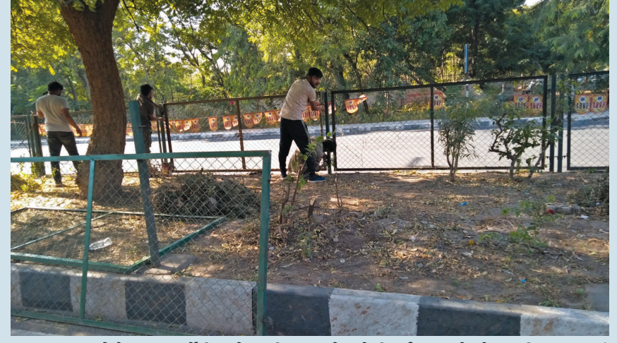
રખડતા ઢોરો મુખ્ય માર્ગોની વચ્ચે આવી ન જાય તે માટે ડીવાઈડર પર ઠેર ઠેર જાળી લગાવવામાં આવી છે. આ જાળી ઘણી જગ્યાએ તુટી ગઈ હોવાથી હાલમાં તેનું રીપેરીંગ કામ ચાલી રહ્યું છે. વાયબ્રન્ટ સમિટ નજીક આવતા વિવિધ કામગીરીમાં ઝડપ લાવવામાં આવી છે.

ના સાહેબ, મોઘવારીનો ઈન્ડેક્સ બહુ ઉપયોગી છે... નહીં તો અમારા જેવાને મોઘવારી કેટલી છે એ કદી ખબર જ ન પડે...!!