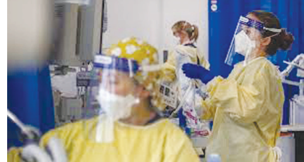
અધિકારીઓનું કહેવું છે કે, બ્રિટન સહિત સમગ્ર યુરોપમાં ક્રિસમસ અને નવા વર્ષની ઉજવણીની તૈયારીઓ ચાલી રહી છે અને તેના કારણે કોરોના વધારે ફેલાય તેમ છે. વિવિધ દેશોની સરકારો જો કોરોનાને ફેલાતો અટકાવવા માટે પ્રતિબંધો લાગુ કરશે તો લોકોને તહેવારો સમયે નિરાશ થવાનો વારો આવશે.

લંડન, તા. ૧૬ બ્રિટનમાં કોરોનાના નવા ઓમિકોન વેરિયન્ટના જોખમ વચ્ચે કોરોના હાહાકાર મચાવી રહ્યો છે. બ્રિટનમાં કોરોનાના દર્દીઓના તમામ રેકોર્ડ તુટી ગયા છે અને છેલ્લા ૪ કલાકમાં કોરોનાના નવા ૭૮૦૦૦ કેસ સામે આવ્યા બાદ સરકાર હચમચી ગઈ છે. બ્રિટનમાં અત્યાર સુધીમાં એક કરોડ જેટલા