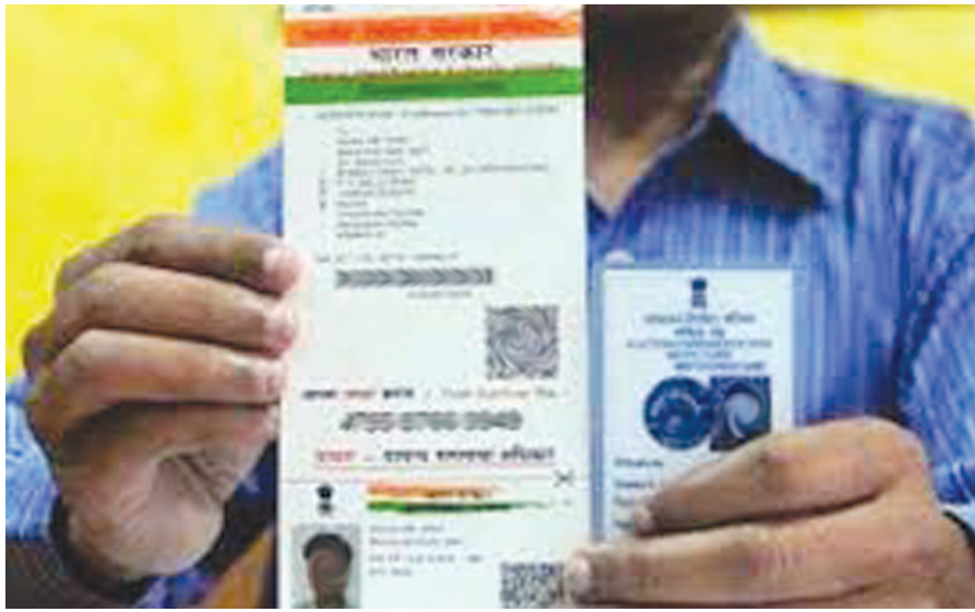
નવી દિલ્હી, તા. ૧૬ કેન્દ્રીય મંત્રી મંડળે ચૂંટણી સુધારાઓને લઈ એક મહત્વનો નિર્ણય લીધો છે. બુધવારે એકબિલને મંજૂરી આપવામાં આવી છે જેમાં બોગસ મતદાન અને મતદાર યાદીમાં રીપિટેશનરોકવા માટે મતદાતા ઓળખ પત્ર (વોટર કાર્ડ)ને આધાર કાર્ડ સાથે જોડવા, એક જ મતદાર યાદી તૈયાર કરવા જેવા નિર્ણયોનો સમાવેશ થાય છે. મંત્રી મંડળ તરફથી મંજૂર કરવામાં આવેલા બિલમાં સર્વિસ વોટર્સ માટે ચૂંટણી કાયદાને 'જેન્ડર-ન્યૂટ્રલ' પણ બનાવવામાં આવશે. બિલમાં એવી જોગવાઈ પણ કરવામાં આવી છે કે, હવે એક વર્ષમાં ૪ અલગ અલગ

ચૂંટણી સુધારાને લઈને કેન્દ્ર સરકારનો મહત્વનો નિર્ણય : કેન્દ્રીય મંત્રી મંડળ તરફથી મંજૂર કરવામાં આવેલા બિલમાં સર્વિસ વોટર્સ માટે ચૂંટણી કાયદાને જેન્ડર ન્યૂટ્રલ પણ બનાવવાનો નિર્ણય લેવામાં આવ્યો