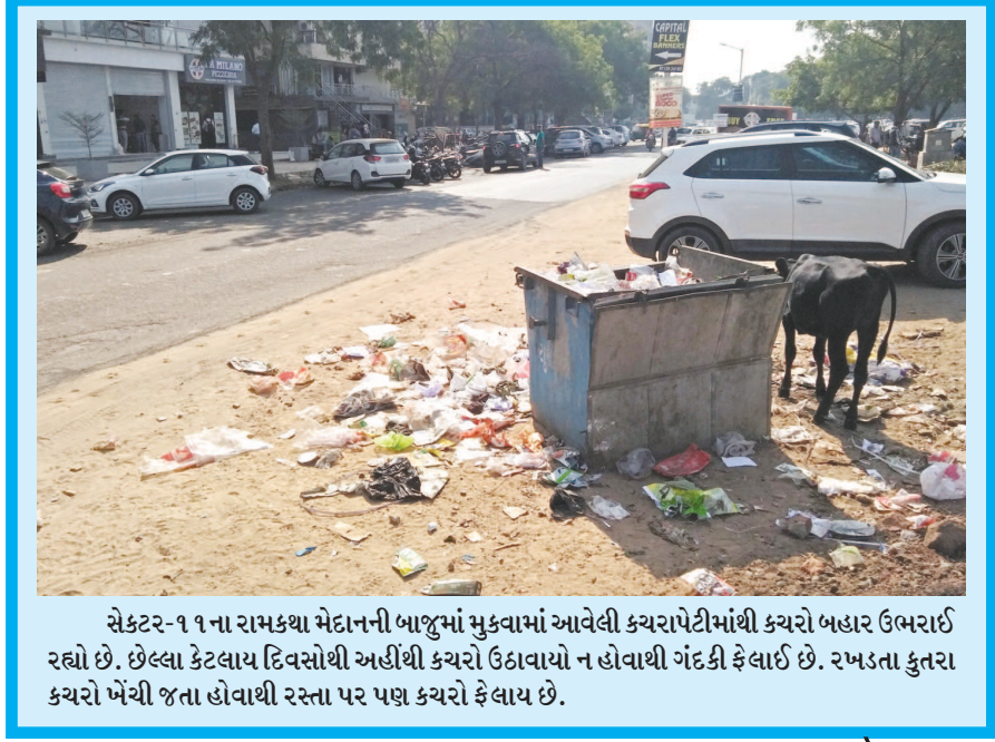
સેક્ટર-૧ ના રામકથા મેદાનની બાજુમાં મુકવામાં આવેલી કચરાપેટીમાંથી કચરો બહાર ઉભરાઈ રહ્યો છે. છેલ્લા કેટલાય દિવસોથી અહીંથી કચરો ઉઠાવાયો ન હોવાથી ગંદકી ફેલાઈ છે. રખડતા કુતરા કચરો ખેંચી જતા હોવાથી રસ્તા પર પણ કચરો ફેલાય છે.