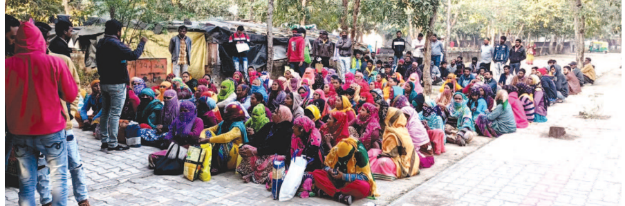
શહેરમાં સતત બીજા દિવસે પણ સફાઈ કામગીરી ઠપ્પ

ગાંધીનગર, તા. ૧૬ ગાંધીનગરના સફાઈ કામદારોએ આજે બીજે દિવસે પણ અનિયમિત પગાર અને સ્માર્ટ મનપાની કચેરીના દરવાજા પર મુકી દીધી હતી. બુધવારે એક દિવસની હડતાલ બાદ પણ માંગણીઓ નહિ કામદારો સાથે પ્રાથમિક ચર્ચા બાદ તેઓ સ્થળ પરથી સંચાલક જતા રહ્યા હતા. એજન્સીને કામદારો વચ્ચેના પ્રશ્ને તંત્ર હેરાન થઈ રહ્યાની વાતો ચર્ચાતી સાંભળવા મળી હતી.