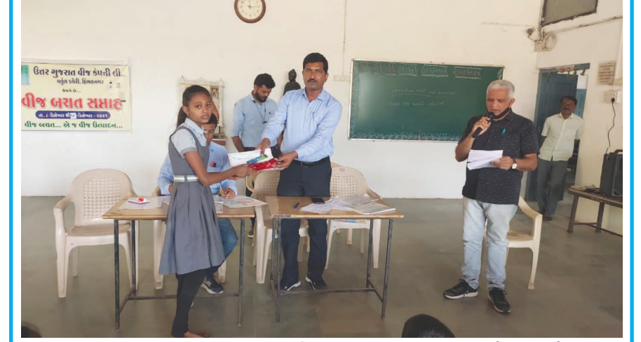
જનમત મેળવવા માટે ભાજપા