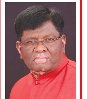
પ્રવિણ ગાડન સોસાયટી બાયડ, જુલો અરવલ્લી