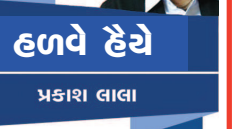
હળવે હેવે પ્રકાશ લાલા

માયામીમાં 'ડિઝાઈનર ડિસ્ટ્રીક્ટ' એરિયા એટલે જવેલરી, ગાર્મેન્ટ્સ, સૂઝ, વોચીસ અને જેન્ડ્રસ - લેડિઝ એક્સેસરીઝની વર્લ્ડ ટોપ 'બ્રાન્ડેડ શોપ્સ'ની સ્ટ્રીટ્સ જેની નામાંકિત ડિઝાઈનરોએ આપણે જોતા જ રહી જઈએ એવી અવનવી રીતે કરેલી સજાવટ. તો નેબરહૂડ 'લીટલ હવાના'માં ક્યુબિયન (ક્યુબા)નું કલ્ચરલ - હેરિટેજ - સાચવી રાખતાં ઘરો, ફુકાનો, ડાન્સ - મ્યુઝિક તથા વિશેષ તો મિ. વિન્ડર યુવીલના મોં માં કાયમ જોવા મળતી 'સિગાર' ના હસ્ટેન્ટલોગ જોવા. 'વીનવુડ વોલ્સ' તો રંગોને ચિત્રકારથી ભર્યાં ભર્યાં વિસ્તાર. જ્યાં બધાં મકાનો, શોપ્સની દીવાલો પેઈન્ટીંગથી શણગારેલી ભરી જ પછ એક એવો 'ઓપનએર વોલ્ડ' પ્લાઝા જ્યાં ઊભી કરાયેલી દીવાલો પર વિવિધ દેશોના પાંગરોએ નીવડેલા કલાકારોએ સજ્જલા ને સર્જતા રહેતાં વિવિધ 'ધીમ' પરતાં અને એબેસ્ટ્રેક્ટ પેઈન્ટિંગ મણવા મળે છે... સાથે આર્ટ આર્ટિકલ્સ, બુક્સ અને સુવેનિયર શોપ્સ ખપ ખપી જ... અહીં ફૂટપાથ પર બેસીને ચિત્રો સર્જતાં ને વેચતા આર્ટિસ્ટને મળવાની ય મજા પડે... આ બધું જોઈને થાય કે જગતમાં રહિનથી 'હડીને' જો પોતાના શોખ-હોબીમાં વ્યસ્ત કેવા કેટલા કલાકારો પડ્યા છે અને કેવી કેવી પ્રવૃત્તિઓ થતી રહે છે ! આ બધું જોઈને થાય કે જગતમાં રહિનથી 'હડીને' જો પોતાના શોખ-હોબીમાં વ્યસ્ત કેવા કેટલા કલાકારો પડ્યા છે અને કેવી કેવી પ્રવૃત્તિઓ થતી રહે છે !