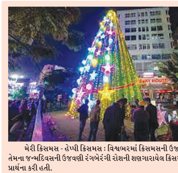
મેરી ક્રિસમસ - હેપ્પી ક્રિસમસ : વિશ્વભરમાં ક્રિસમસની ઉજવણી ભારે ઉલ્લાસ અને ઉમંગપૂર્વક થઈ હતી... ખ્રિસ્તી પરિવારો અને ભગવાન ઈશુના યાદકો - ભાવકોએ તેમના જન્મદિવસની ઉજવણી રંગબેરંગી રોશની શણગારાયેલ ક્રિસમસ ટ્રી અને શાન્તાકલોઝની ગીફ્ટથી ધામધૂમથી ઉજવણી કરાઈ હતી... સાથે સાથે ખ્રિસ્તી પરિવારોએ ચર્ચમાં પ્રાર્થના કરી હતી.