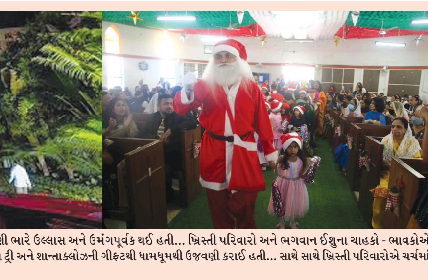
મેરી ક્રિસમસ - હેપ્પી ક્રિસમસ : વિશ્વભરમાં ક્રિસમસની ઉજવણી ભારે ઉલ્લાસ અને ઉમંગપૂર્વક થઈ હતી... ખ્રિસ્તી પરિવારો અને ભગવાન ઈશુના યાદકો - ભાવકોએ તેમના જન્મદિવસની ઉજવણી રંગબેરંગી રોશની શણગારાયેલ ક્રિસમસ ટ્રી અને શાન્તાકલોઝની ગીફ્ટથી ધામધૂમથી ઉજવણી કરાઈ હતી... સાથે સાથે ખ્રિસ્તી પરિવારોએ ચર્ચમાં પ્રાર્થના કરી હતી.