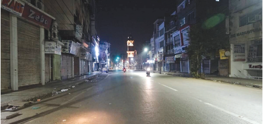
કેસ દરેક રાજ્યની ચિંતામાં સતત વધારો કરી રહ્યા છે. જોકે, તેનો લાભી રહ્યા છે. બગડતી પરિસ્થિતિને જોતા દિલ્હીમાં પણ ડિસેમ્બરથી લાગુ થશે. આ રાત્રિ કરફ્યુ રાત્રે ૧૧ વાગ્યાથી સવારે ૫

રસી ગંભીરતા અને મોતને રોકવામાં પ્રભાવી છે. તેમણે કહ્યું કે, અતિસંવેદનશીલ વસ્તીમાં કોવિડ-૧૯ના કારણે મૃત્યુ દર લગભગ ૧.૫ ટકા છે. તેનો અર્થ છે કે, પ્રતિ ૧૦ લાખ વસ્તી પર ૧૫,૦૦૦ મોત. રાય મુજબ, વેક્સીનેશનથી આપણે તેમાંથી ૮૦-૯૦ ટકા મોતને રોકી શકીએ છીએ, જેનો અર્થ છે કે, પ્રતિ ૧૦ લાખ (વસ્તી)માં ૧૩,૦૦૦થી ૧૪,૦૦૦ મોતને રોકી શકાય છે. તેમણે કહ્યું કે, વેક્સીનેશન પછી ગંભીર સાઈડ ઈફેક્ટ પણ જોવા મળી છે. આ આંકડો પ્રતિ દસ લાખ વસ્તીમાં ૧૦થી ૧૫ની વચ્ચે છે. તેમણે કહ્યું કે, બાળકોના મામલે સંક્રમણની ગંભીરતા ઘણી ઓછી છે.