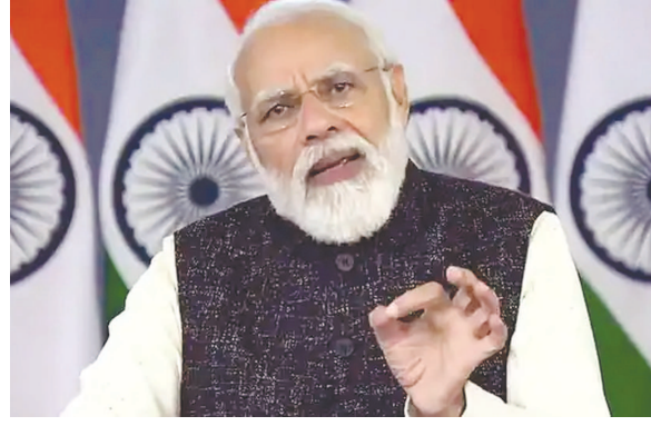
૨૦૨૧ને વિદાય આપવા અને ૨૦૨૨ને આવકારવાની તૈયારી કરી રહ્યા હશે. નવા વર્ષ નિમિત્તે દરેક વ્યક્તિ, દરેક સંસ્થા આવનારા વર્ષમાં કંઈક સારું કરવા, વધુ સારા બનવાનો સંકલ્પ લે છે. છેલ્લા સાત વર્ષથી આપણી મન કી બાતલ પણ વ્યક્તિ, સમાજ, દેશની સારી બાબતોને

નવી દિલ્હી, તા. ૨૬ વડાપ્રધાન નરેન્દ્ર મોદીએ રવિવારે રેડિયો કાર્યક્રમ 'મન કી બાતલના' માધ્યમથી દેશને સંબોધિત કર્યા હતા. દર મહિનાના છેલ્લા રવિવારે પીએમ મોદી 'મન કી બાતલ કરે છે. આજે મન કી બાતલની ૮૪મી આવૃત્તિ હશે. આ 'મન કી બાતલ' આ વર્ષનો અંતિમ કાર્યક્રમ હતો. આજે વિશ્વમાં ૨૩ સીકરણના જે આંકડા છે, તેની સરખામણી ભારત સાથે કરીએ, તો લાગે છે કે દેશ કેટલું અભૂતપૂર્વ કામ કર્યું છે. વેક્સીનના ૧૪૦ કરોડ ડોઝનો માઈલસ્ટોન પાર કરવો, એ દરેક ભારતીયની સિદ્ધિ છે. વડાપ્રધાન મોદીએ મન કી બાતલનો ૮૪મો એપિસોડ શરૂ કર્યો. તેમણે કહ્યું, આ સમયે તમે