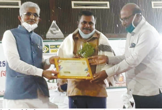
શૈક્ષણિક ભેત્રે યોગદાન આપવામાં અગ્રેસર તેમજ ગામના વિકાસ અને ગામની સહકારી સંસ્થાઓ કેવી રીતે વધુ સમૃદ્ધ બને તેવા પ્રયાસની પરેશ

પટેલની કામગીરીની નોંધ લેવાવવી જોઈએ. તેમને અનેક યુવાઓની