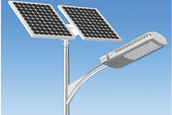
સૂર્ય ઉર્જાથી ગ્રામ્ય વિસ્તારોમાં અંધારાં ઉલેચવાનું આયોજન કરવામાં આવ્યું હતું પરંતુ જે તે સમયે હલકી ગુણવત્તાની ખરીદી થતાં ગામડાઓમાં આંગળીના વેડે ગણી શકાય તેટલી સ્ટ્રીટ લાઈટો અજવાળાં પાથરી રહી છે.

બાયડ (બ્યુરો ઓફિસ) તા.૩૦ સાબરકાંઠા, અરવલ્લી જિલ્લાની ૭૨૦ થી વધુ ગ્રામ પંચાયતોમાં ૧૪મા નાણાપંચ હેઠળ ખરીદાયેલ હજારો સ્ટ્રીટ લાઈટો ૮ વર્ષના સમયગાળામાં શોભાના ગાંઠીયારૂપ બની ગઈ છે. કેટલાક વિસ્તારોમાં તો જે સ્થળે સોલાર લાઈટ ગોઠવવામાં આવી હતી તે સ્થળેથી શાંભલા પણ ગાયબ થઈ ગયા છે. સૂર્ય ઉર્જાથી ગ્રામ્ય વિસ્તારમાં અંધારાં ઉલેચવાનું આયોજન કરવામાં આવ્યું હતું પરંતુ જે તે સમયે હલકી ગુણવત્તાની ખરીદી થતાં ગામડાઓમાં આંગળીના વેડે ગણી શકાય તેટલી સ્ટ્રીટ લાઈટો અજવાળાં પાથરી રહી છે.