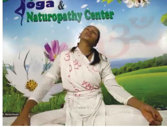
ગાંધીનગર, તા. ૧ બાપુ ગુજરાત નોલેજ વિલેજ કેમ્પસની વિવિધ કોલેજમાં પ્રાધ્યાપક તરીકે સેવા આપતી ફિમેલ ફેકલ્ટી અને કોલેજમાં અભ્યાસ કરતી વિદ્યાર્થીનીઓ માટે 'યોગની સ્ત્રી ના હોર્મોન્સ અને પોલિસિસ્ટિક ઓવરી સિંડ્રોમ (પીસીઓએસ) પર થતી અસર' વિષય પર યોગનો ઓનલાઈન કાર્યક્રમ યોજાયો હતો.