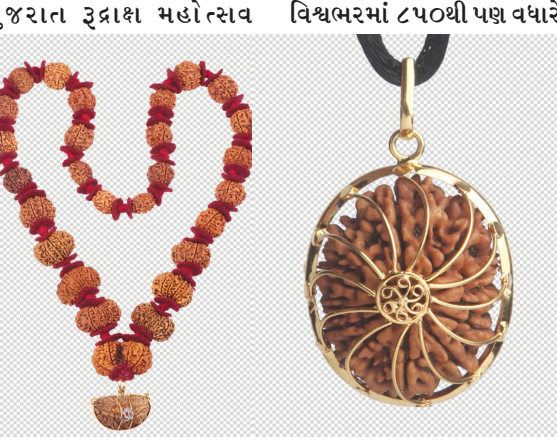
નિમિત્તે આકર્ષક કિંમતો રજૂ કરવામાં આવશે. અંગે સફળ રૂદ્રાક્ષના પ્રચાર અને પ્રસાર પ્રદર્શન કરવામાં આવેલા