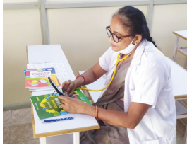
પરવા કર્યા વગર સેવા આપનારની પ્રશંસા રૂપે અને જે

તબીબીઓએ જાન ગુમાવ્યા છે તેમને શાળાના વિદ્યાર્થીઓએ, શિક્ષકોએ, ટ્રસ્ટીઓએ, આચાર્યશ્રીએ શ્રદ્ધાંજલિ અર્પિત કરી હતી. જેની ઉજવણી ભાગરૂપે ઓનલાઈન આ પ્રવૃત્તિમાં વિદ્યાર્થીઓએ પોતાના ઘરે રહી ભાગ લીધો હતો. જેમાં વાલીશ્રીઓ પણ જોડાયા હતા.