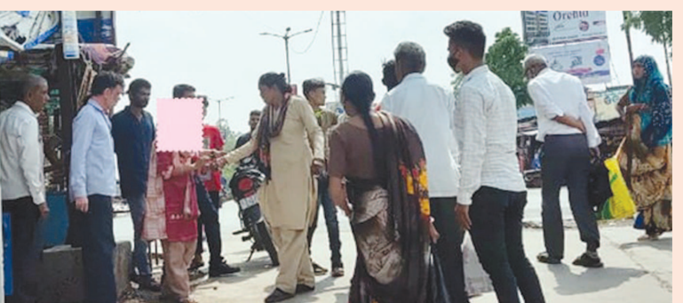
ડિસ્સાઓમાં વાંક ન હોય તો પણ વગર વાંકે માર ખાવો પડે, અપમાન સહન કરવું પડે. કોણ સાહુકાર તેની સમજ આવી જાય. તા.૮ જુલાઈના રોજ બાયડ બસ મથકમાંથી ઉતરેલી યુવતીએ હોમગાર્ડ પોતાની ફરજના ભાગરૂપે મામલો કુનેહપૂર્વક સમેટી લીધો.

બાયડ (બ્યુરો ઓફિસ) તા.૦૮ બાયડ બસ મથકમાં ગુરુવારે બસમાંથી ઉતરતાં સમયે યુવતીને ધક્કો વાગતાં તેની અદાવત રાખી યુવકને ચપ્પાલ વડે ફટકારતાં દંગલ મર્યું હતું. યુવકે છોડતી કરી હશે તેવી આશંકાએ ટોળું એકત્ર થયું પરંતુ પછી ખબર પડી કે યુવતી માનસિક અસ્વસ્થ છે. ત્યારબાદ મહિલા હોમગાર્ડની સમજાવટથી મામલો થાળે પડ્યો છે..આને કહેવાય જરૂર વગરની ઉપાધી. જિલ્લાના બસ મથકોમાં બનતી અનેક ઘટનાઓએ કાળા માથાના માનવીને કેવું જીવન જીવવું જોઈએ તેવા બોધપાઠ આપે છે. કેટલાક આધુનિક બસ મથકોમાં વિભાગે સાડાં કર્યું છે કે સી.સી.ટીવી કેમેરા લગાડ્યા છે જેથી કોણ ગુનેગાર, એક યુવકને ચપ્પાલ વડે ફટકારતાં બસ મથકના મુસાફરો એકત્ર થઈ ગયા. કેટલાકે તો યુવકને ફટકારવા માટે હાથ પણ દબોલ્યા પરંતુ પછી ખબર પડી કે યુવક તો બિચારો નિર્દોષ છે અજાણતાં જ બસમાંથી ઉતરતી વખતે ધક્કો વાગ્યો અને યુવતીએ ચપ્પાલ કાઢી યુવકને ફટકારતાં કોણ સમજદાર તેના તર્કમાં ટોળું વધ્યું પરંતુ કોઈએ સમજાવટનો વિવેક ન દાખવ્યો આખરે મહિલા હોમગાર્ડ પોતાની ફરજના ભાગરૂપે મામલો કુનેહપૂર્વક સમેટી લીધો.