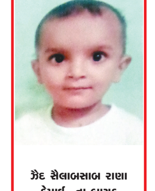
ઝેદ સૈલાબસાળ રાણા કેમાઈ, તા. બાયડ