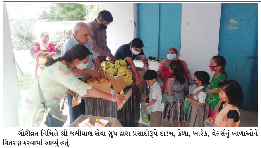
ગૌરીવ્રત નિમિત્તે શ્રી જલધિપાલ સેવા યુપ દ્વારા પ્રસાદીરૂપે દાડમ, કેળા, ખારેક, વેફરસું બાળાઓને વિતરણ કરવામાં આવ્યું હતું.