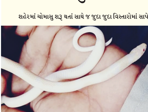
૧૮૭૨ હેઠળ સાપની પ્રજાતિને સંરક્ષિત જાહેર કરવામાં આવેલ છે.

ગાંધીનગર, તા. ૨૧ શહેરમાં ચોમાસુ શરૂ થતાં સાથે જ જુદા જુદા વિસ્તારોમાં સાપ દેખાવાનું શરૂ કરી દીધું છે. શહેરમાં પકડાતા સાપમાંથી વધુ સાપ કોબા પકડાય છે. શહેરમાં નીકળતા બિનઝેરી સાપ માત્ર ૩૦ ટકા હોવાથી સાપ નીકળતાં જ લોકોના હોશ ઉડી જાય છે ત્યારે ગાંધીનગરમાં બીનઝેરી સાપની યાદીમાં સમાવિષ્ટ કોલ્યુબ્રીટી ફેમીલીનો કોમન કુકરી નામનો સાપ જોવા મળ્યો હતો. જે અતિ દુર્લભ સફેદ રંગનો છે. આ સાપની લંબાઈ બે થી અઢી ફૂટ આસપાસ હોય છે. વન્ય પ્રાણી સંરક્ષણ અધિનિયમ