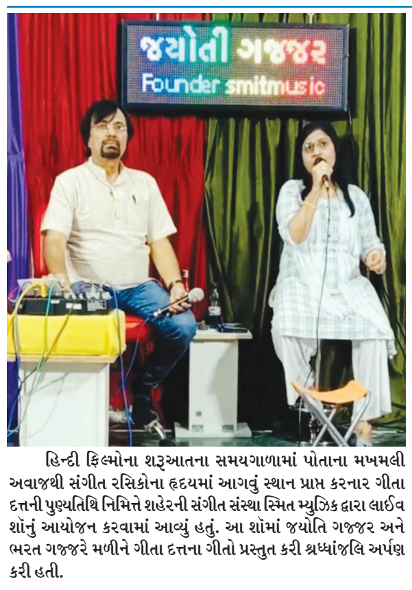
હિન્દી ફિલ્મોના શરૂઆતના સમયગાળામાં પોતાના મખમલી અવાજથી સંગીત રસિકોના હૃદયમાં આગવું સ્થાન પ્રાપ્ત કરનાર ગીતા દત્તની પુણ્યતિથિ નિમિત્તે શહેરની સંગીત સંસ્થા સ્મિત મ્યુઝિક દ્વારા લાઈવ શોનું આયોજન કરવામાં આવ્યું હતું. આ શોમાં જયોતિ ગજજર અને ભરત ગજજરે મળીને ગીતા દત્તના ગીતો પ્રસ્તુત કરી શ્રદ્ધાંજલિ અર્પણ કરી હતી.

રહી છે ત્યારે સરકારે બાગ-બગીચા, જિમ, સ્વિમિંગ પુલ, મંદિરો, વોટર પાર્ક સહિત અનેક સ્થળો ખોલી આપ્યા છે તો શાળા પણ રાખેતા મુજબ શરૂ કરવી જોઈએ. ગરીબ અને સુંપડામાં રહેતા બાળકો માટે શિક્ષકો કેટલાક સ્થળો પર બેસીને શિક્ષણ આપી રહ્યા હતા. જેમકે વૃશો નીચે, બાગ-બગીચામાં, જાહેર સ્થળો પર વગેરે પરંતુ ચોમાસામાં વરસાદના કારણે તેમને પણ મુશ્કેલીનો વારો આવી ગયો છે. વરસાદના કારણે શિક્ષકો નિયમિત શિક્ષણ કાર્ય કરી શકતા નથી. આ બાબતે સરકાર દ્વારા તાત્કાલિક વિદ્યાર્થીઓના હિતમાં નિર્ણય લેવાય તેવી માંગ કરવામાં આવી છે. સંવેદનશીલ સરકારે શિક્ષકો અને સંચાલકો માટે પણ ચોક્કસ વિચારવું જોઈએ. તમામ ખાનગી અને સરકારી સ્કૂલોના સંચાલકો દ્વારા સંવેદનશીલ સરકારને શાળાઓ રાખેતા મુજબ શરૂ કરવાની માંગ કરવામાં આવી છે.