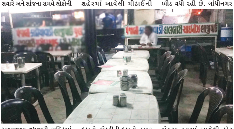
અવરજવર વધવાથી ટ્રાફિકમાં પણ વધારો જોવા મળી રહ્યો છે.

ગાંધીનગર, તા. ૨૨ કોરોના ઘટચો હોવાની અસર શહેરના રસ્તા અને બજારમાં પણ જોવા મળી રહી છે. કોરોના ઘટચો ટ્રાફિક વધ્યો છે અને શહેરના ખાણી-પીણી બજારોમાં સાંજે ભીડ જોવા મળી રહી છે. હાલમાં ધંધા રોજગાર કેટલાક અંશે પાટે ચઢી રહ્યા છે. ત્યારે બજાર વિસ્તારોમાં સંચાર શરૂ થયો છે. લાંબા સમય પછી રવિવારની રજાના દિવસે ખાણી પીણીના ટેક-અવે સેવામાં લોકોની ભીડ જોવા મળી હતી. શહેરના રસ્તાઓ પર બપોરના સમયે ગરમી અને બફારાના કારણે લોકોની સંખ્યા ઘટી જાય છે પરંતુ