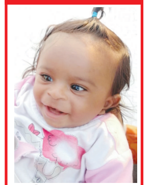
ઠાકોર મંથન સાગરભાઈ શિલા મંડપ કેકોરેશન બાયડ જી. અરવલ્લી