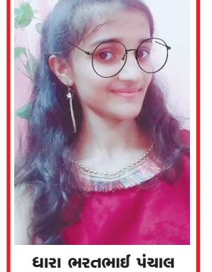
ધારા ભરતભાઈ પંચાલ પાવન રેસીડેન્સી, બાયડ જી. અરવલ્લી