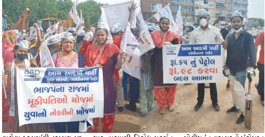
લાગેલા ફટકામાંથી હજુ પણ કળ વળી નથી ત્યાં મોંઘવારી માઝા મૂકવા માંડી છે. દિન પ્રતિદિન પેટ્રોલ, ડીઝલ, રાંધણગેસ સહિત અનેક જીવન જરૂરિયાતની ચીજવસ્તુઓના ભાવ આસમાન તરફ જઈ રહ્યાં છે જેના કારણે પ્રજામાં આકોશ વ્યાપી રહ્યો છે.

ગાંધીનગર, તા. ૨૪ એક તરફ કોરોના મહામારીના કાળમાં લાંબા લોકડાઉનને કારણે વેપાર-વ્યાપાર જનતાની વેદનાને વાચા આપવાના ઉદ્દેશથી આજે આમ આદમી પાર્ટી દ્વારા સેક્ટર-૬માં સત્યાગ્રહ છાવણી ખાતે બપોરે