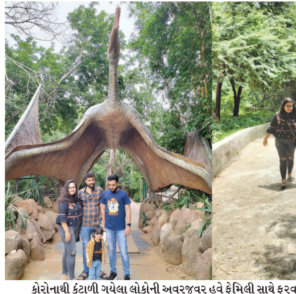
કોરોનાથી કંટાળી ગયેલા લોકોની અવરજવર હવે ફેમિલી સાથે ફરવા ઈન્ડોડા પાર્ક આવવા લાગ્યા છે. તેમાં પણ ડાયનાસોર પાર્કનું આકર્ષણ તો ખૂબજ નાના બાળકો જે ૨૦૨૦માંથી ઘરમાં ભરાઈ ગયેલા છે તેમને માટે તો અદ્ભુત આકર્ષણ છે. લોકો સોરથલ ડીસ્ટન્સ સાથે પોતાના શુપમાં જોવા મલતા હતા.