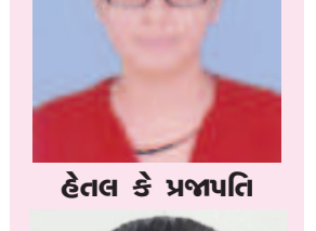
હેતલ કે પ્રજાપતિ