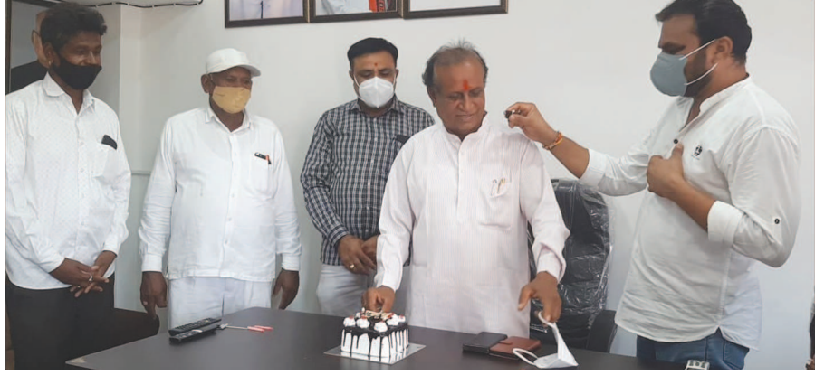
સાબરકાંઠા-અરવલ્લી સાસંદે સાંદગીપૂર્વક જન્મ દિવસ ઉજવ્યો