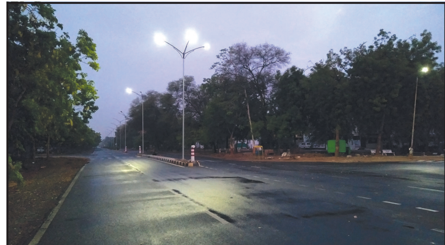
ગરમી વચ્ચે વાતાવરણમાં વારંવાર પલ્ટો જોવા મળી રહ્યાં છે. જ્યારે આજે પણ વહેલી સવારે વરસાદી વાવાઝોડાના લીધે પણ જનજીવન પ્રભાવિત થયું હતું. અચાનક જ વાતાવરણમાં બદલાવ હળવા ભારે વરસાદી ઝાપટા વરસ્યા હતા. જો કે વાતાવરણ પલ્ટાના અંતે દિવસ દરમિયાન

ગાંધીનગરમાં આકરા ઉનાળે વારંવાર મોસમનો મિજાજ બદલાય છે. અગાઉ પણ વરસાદી વાવાઝોડાના લીધે બે દિવસ સુધી સતત વાદળિયુ વાતાવરણ રહ્યું હતું. જ્યારે આકરી ગરમીની મોસમ નિખરવાની સાથે વારંવાર આકાશી નજારો બદલાય છે. અવારનવાર વરસાદ વરસાદી ઝાપટા ચોમાસુ નજીકમાં હોવાનો અહેસાસ નગરજનો કરાવી જાય છે. આજે વહેલી સવારે પણ અચાનક જ વાતાવરણમાં પલ્ટો જોવા મળ્યો હતો. ગઈકાલની આકરી ગરમી બાદ સવારના સમયે વાતાવરણ બદલાયું હતું. આકાશમાં કાળા ડીબાંગ વરસાદી વાદળો ઘેરાઈ આવ્યા હતા જ્યારે ગાજવીજ સાથે વરસાદી ઝાપટુ વરસ્યું હતું. જેના લીધે શહેરમાં ભીંજારાનો માહોલ જોવા મળ્યો હતો. વાદળિયા વાતાવરણ વચ્ચે વરસાદી ઝાપટાથી નગરમાં ભીની માટીની મહેક પ્રસરી હતી. જ્યારે કેટલાક સેક્ટરોમાં હળવુ અને કેટલાક ઠેકાણે બે ઘડી જોરદાર ઝાપટુ વરસતા ઠેર ઠેર પાણીના ખાભોચિયા ઉભરાયા હતા. તો કેટલાક સેક્ટરોમાં આ વાતાવરણ પલ્ટાની અસર જોવા મળી ન હતી. વહેલી સવારે અચાનક જ વાતાવરણમાં બદલાવ આવતા દિવસ દરમિયાન મોસમ પલ્ટો નગરજનોમાં ચર્ચાનો વિષય રહ્યો હતો. પ્રિ મોન્સુન એક્ટીવીટીના ભાગરૂપે વરસાદી વાયરો ઠુંકાયો હતો. જો કે થોડીવારમાં જ વાતાવરણ ચોખ્ખુ થઈ ગયું હતું. દિવસ દરમિયાન આકરા તાપ વચ્ચે નગરજનોએ ગરમીનો અહેસાસ કર્યો હતો. મહત્તમ તાપમાન ૩૮ ડીગ્રી રહ્યું હતું.