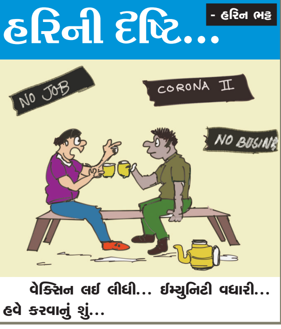
વેક્સિન લઈ લીધી... ઇમ્યુનિટી વધારી... હવે કરવાનું શું...