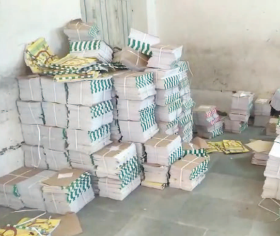
પાલનપુરની ૨૭ સેન્ટરો પર ધો-૩ થી ૮ના પુસ્તકો પહોંચાડવામાં આવ્યા

સરહદી બનાસકાંઠા જિલ્લામાં વિસ્ફોટક બેટિંગ કરતા કોરોનાની રફતાર આજે સુડતાલીસમાં દિવસે પણ ધીમી રહી હતી. આમ, સરકારી નિયંત્રણો વચ્ચે છેલ્લા ૨૧ દિવસથી ધીમે ધીમે કોરોના સંક્રમણ તેના અંત તરફ આગળ વધી રહ્યું છે.