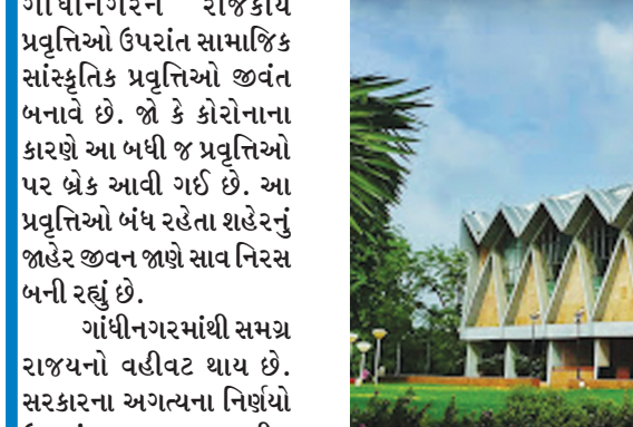
કાર્યક્રમો ઉપરાંત સાહિત્યિક કાર્યક્રમો આ શહેરની ઓળખ બનાવે છે. નવરાત્રીની અમદાવાદથી પણ ખેલેયાઓ પરંપરાગત નવરાત્રીની ઉજવણી માટે ગાંધીનગર

અને સાંસ્કૃતિક પ્રવૃત્તિઓ પર પણ બ્રેક લાગી ગઈ છે. ગુજરાતના સૌથી મોટા તહેવાર ગણાતા નવરાત્રીની ઉજવણી એકદમ સાદાઈથી કરવામાં આવી હતી. નાટકો અને સંગીતના કાર્યક્રમો છેલ્લા દોઢ વર્ષથી યોજાયા જ નથી. શહેરના મોટાભાગના હોલ ખુકીંગ વિનાના સુના પડ્યા છે. સામાજિક અને સાંસ્કૃતિક પ્રવૃત્તિઓ બંધ રહેતા શહેરના જનજીવનમાં જાણે સાવ નિરસતા આવી ગઈ છે. પુના: જનજીવન અગાઉની જેમ કયાંયે જીવંત અને ધબકતું બને તેની રાહ નાગરિકો જોઈ રહ્યા છે.