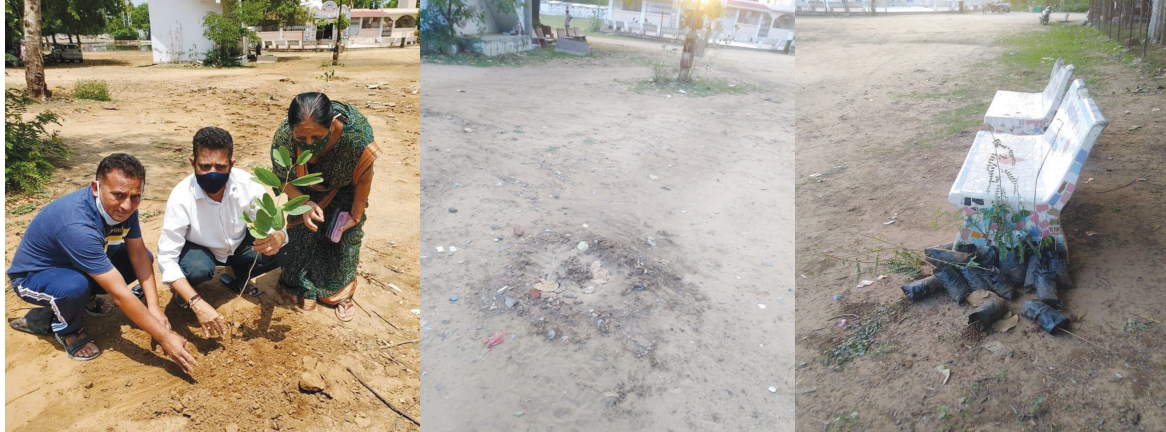
ગાંધીનગર, તા. ૯ તાજેતરમાં સમગ્ર ગાંધીનગરમાં વિશ્વ પર્યાવરણ દિવસની ઉજવણી ખુબ જ જોરશોરથી કરવામાં આવી હતી જેમાં જાગૃત પર્યાવરણ પ્રેમી નાગરિકો તેમજ સ્વેચ્છિક સંસ્થાઓ ઉપરાંત રાજકીય પાર્ટીઓ દ્વારા પણ વૃક્ષારોપણના કાર્યક્રમો કરવામાં આવ્યા હતા. જો કે રાજકીય પાર્ટીઓ દ્વારા કરવામાં આવેલા આયોજનોમાં વૃક્ષારોપણ કરતા ફોટા પડાવવાનું મહત્વ વધારે હોય તેવું સ્પષ્ટ જણાઈ આવતું હતું અને માત્ર વૃક્ષો વાવવાના દેખાડા કરી અને પ્રજાને ગેરમાર્ગે દોરવા સાથે બીજી તરફ સત્તાના મદદમાં વિકાસકાર્યોના નામે વૃક્ષોનું નિકદન કાઢતાં આ રાજકીય પક્ષોનું વૃક્ષારોપણ કેવું હોય છે તે સેક્ટર-૪એમાં ભાજપ દ્વારા કરવામાં આવેલા વૃક્ષારોપણની અત્યારની હાલત ઉપરથી સ્પષ્ટ જોઈ શકાય છે. વિશ્વ પર્યાવરણ દિવસે સે-૪એ ખાતે યોજાયેલા વૃક્ષારોપણ કાર્યક્રમમાં સ્થાનિક ભાજપના નેતાઓએ ખુબ જ જોરશોરથી ફોટા પડાવ્યા હતા અને સોશિયલ મીડિયા પર પર્યાવરણ દિવસની ઉજવણી કર્યાની પોસ્ટ મૂકીને વાહવાહી લૂટી હતી પરંતુ માત્ર ચાર જ દિવસમાં

સે-૪એ ખાતે રાજકીય નેતાઓ દ્વારા વિશ્વ પર્યાવરણ દિવસે કરવામાં આવેલા વૃક્ષારોપણની માત્ર ચાર જ દિવસ પછી થયેલી બદલતથી પર્યાવરણ પ્રેમીઓમાં રોષ : વૃક્ષારોપણ કરતી વખતે ખૂબ ફોટા પડાવી સોશિયલ મીડિયા પર વાહવાહી લૂટી પરંતુ વાવેલા છોડનું જતન ભૂલ્યાં અને વઘેલા છોડ જેમના તેમ ફૂંકી દેવાયાં..!