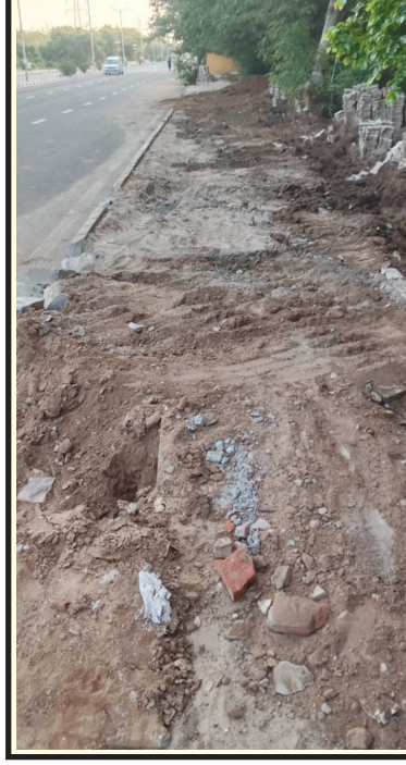
ગાંધીનગર, તા. ૯ ગાંધીનગર શહેરને એક તરફ સ્માર્ટ સિટી બનાવવા કવાયત હાથ ધરવામાં આવી છે પરંતુ બીજી તરફ શહેરના વિકાસ કાર્યો ગુણવત્તાની દૃષ્ટિએ સાવ બોદા હોવાનું અવારનવાર પુરવાર થઈ રહ્યું છે. તાજેતરમાં જ કમોસમી વરસાદના પગલે ઘ-૪ સર્કલે કરોડોના ખર્ચે વિકસાવાયેલા અંડરપાસની ગુણવત્તા બાબતે પોલ ખુલી જવા પામી છે. હવે માંડ અંદાજે પાંચેક માસ પૂર્વે જ બ-મર્ગ પર બ-૧ થી બ-૨ વચ્ચે સે. ૪ પાસે બનાવાયેલી ફૂટપાથ પણ ખૂબ જ સામાન્ય વરસાદમાં પણ ઝડપથી તુટી જતાં તેમાં પણ ભયચાર આચર્યો હોવાની બૂ શહેરીજનોને આવી રહી છે. શહેરમાં જે રીતે એક પછી એક વિકાસ કાર્યો તદ્દન નબળી ગુણવત્તા હોવાનું ખૂલી રહ્યું છે તેની પાછળ જે તે સમયે વહીવટકર્તા સત્તાધીશો દ્વારા કોન્ટ્રાક્ટ આપવામાં સગાવાદ ચાલતો હોવાની જે રાવ ઉઠી રહી છે તે સાચી હોવાનું પ્રતિત થઈ રહ્યું છે ત્યારે શહેરીજનોએ હવે કોને ફરિયાદ કરવી તેવા સવાલો ખડા કરી રહ્યાં છે.