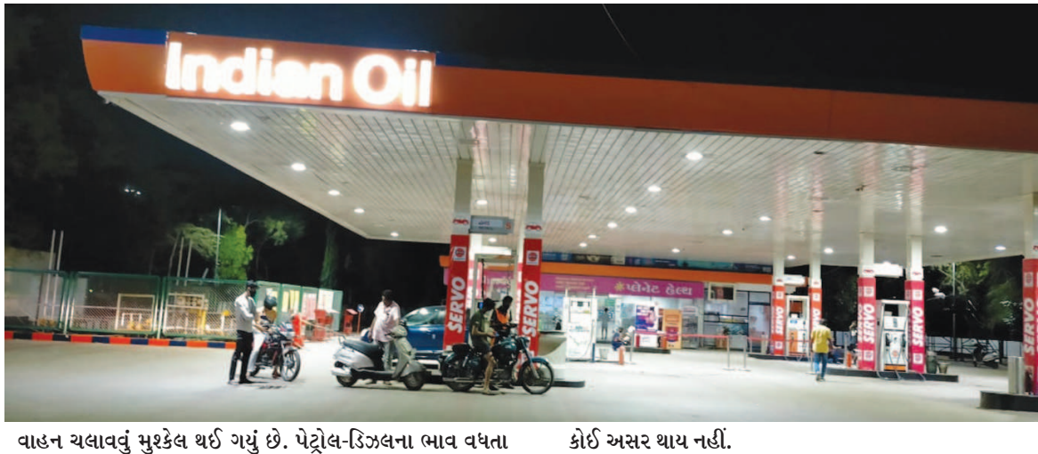
વાહન ચલાવવું મુશ્કેલ થઈ ગયું છે. પેટ્રોલ-ડીઝલના ભાવ વધતા સરકાર સામે શહેરના નાગરિકોમાં રોષ પણ જોવા મળી રહ્યો છે. લોકોએ સાયકલ ચલાવવાનું સાડું રહે તેવું જણાવ્યું હતું. ભાવવધારાના કારણે કેટલાક નગરજનોએ સારા ઉદાહરણો પણ આપ્યા હતા જેમ કે,