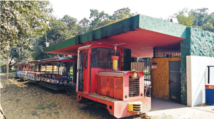
હવે બાળકોને કમને ઘરમાં જ રહીને વેકેશન પસાર કરવું પડ્યું