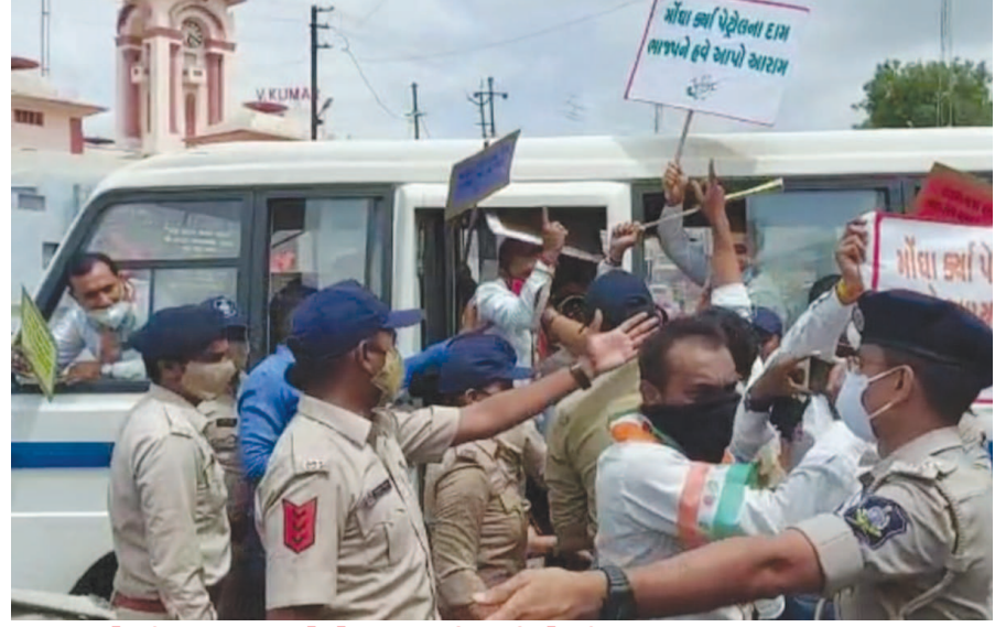
ઈડર પોલીસ દ્વારા કોંગ્રેસ કાર્યકર્તાઓની અટકાયત કરાઈ

બાયડ તા. ૧૧ રાજ્યના શિક્ષણ ઈતિહાસમાં ધો. ૧૦ની બોર્ડ પરીક્ષા આપનારા તમામ છાત્રો પાસ કરી દેવાની ઐતિહાસિક ઘટના નોંધાઈ છે. અનેક શાળાઓમાં ધો. ૧૧ માં પ્રવેશ બાબતે અંધાધૂંધી સર્જાઈ શકે છે ત્યારે બોર્ડે ધો. ૧૦ની માર્કશીટ ન આવે ત્યાં સુધી ધો. ૧૧ માં કોઈપણ વિદ્યાર્થીને પ્રવેશ ન આપવા તમામ ડી.ઈ.ઓ. અને શાળાના આચાર્યોને આદેશ કર્યો છે. ઓનલાઈન સેમીનાર દ્વારા ધો. ૧૦ની માર્કશીટ અંગે માર્ગદર્શન આપવામાં આવ્યું છે. આમ તો ધો. ૧૦ બોર્ડ પરીક્ષા કોઈપણ સંજોગોમાં પાસ ન કરી શકે તેવા વિદ્યાર્થીઓ માટે વર્ષ-૨૦૨૧ નું વર્ષ શુક્રનિયાળ બન્યું. કોરોનાના કારણે બે વખત બોર્ડ પરીક્ષાનું આયોજન પાછું ઠેલાયું છેવટે સરકાર દ્વારા બોર્ડ પરીક્ષા નહીં યોજવાનો નિર્ણય કરી તમામ વિદ્યાર્થીઓને માસ પ્રમોશન આપવાનું નક્કી કરાતાં સાબરકાંઠા, અરવલ્લી, બનાસકાંઠા, પાટણ અને મહેસાણા જિલ્લાની શાળાઓના ૧.૩૫ લાખથી વધુ રેગ્યુલર છાત્રોને ધો. ૧૦માં ઉત્તિર્ણ કરી ધો. ૧૧માં પ્રવેશ માટે લાયક ઠેરવવામાં આવ્યા છે. કેટલીક શાળાઓમાં તો ધો. ૧૧ નો પ્રવેશ શરૂ થયો છે જેથી સફળતા જાળવવા માધ્યમિક શિક્ષણ બોર્ડે ઓનલાઈન સેમીનાર દ્વારા જ્યાં સુધી ધો. ૧૦ની માર્કશીટ ન આવે ત્યાં સુધી ધો. ૧૧ માં પ્રવેશ ન આપવા સુચના આપી છે. ધો. ૧૦ની માર્કશીટનું માર્ગદર્શન અપાયું પરંતુ ધો. ૧૨ની માર્કશીટ અંગે કોઈ માર્ગદર્શન ન મળતાં આચાર્યો અને વર્ગ શિક્ષકો પણ મૂંઝવ્યા છે.