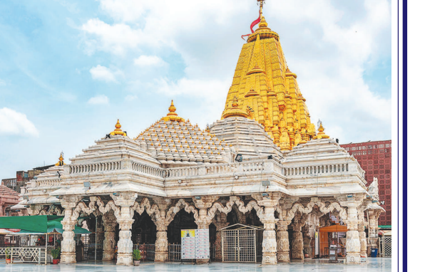
થતાં ભક્તોના દર્શન માટે કં ટ લી ક શ ર તો નો અ િ િ ન મો લ વ મા આ વ્યું છે. અંબાજીમાં આવતા યાત્રાળુઓ માટે સદાવ્રત પ્રોજેક્ટ હેઠળ આજે સોમવારથી મફત ભોજન સેવા શરૂ થશે જેના કારણે મ્હા અંબાના ભક્તોમાં ખુશાલી જોવા મળી છે.

કોરોનાના કારણે જગત જનની મ્હા અંબાના પ્રાગટ્ય ધામ અંબાજી મંદિર બે મહિનાથી બંધ હતું જે કોરોનાનું સંક્રમણ ઓછું કરવામાં આવી હતી જેનું સંચાલન જલિયાણા સદાવ્રત દ્વારા સંચાલિત જય જલિયાણા ફાઉન્ડેશન હસ્તક હતું. સદાવ્રતનું આયોજન આગામી ૩ મહિના માટે કરવામાં આવ્યું છે. જિલ્લા કલેક્ટરના