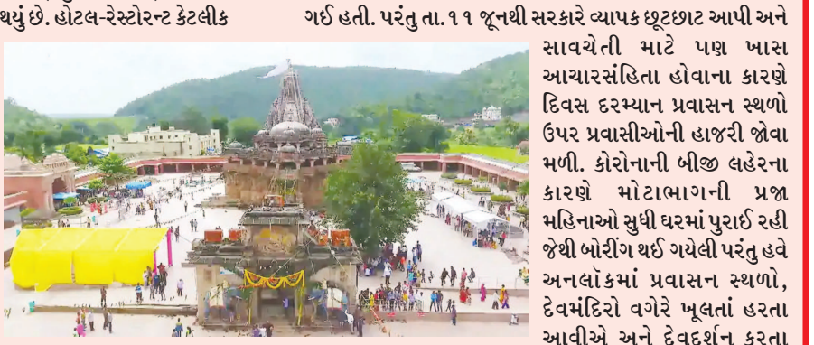
રોજગાર લઈને બેઠેલા વેપારીઓની આર્થિક હાલત ડામાડોળ થઈ ગઈ હતી. પરંતુ તા. ૧૧ જૂનથી સરકારે વ્યાપક છૂટછાટ આપી અને સાવચેતી માટે પણ ખાસ આચારસંહિતા હોવાના કારણે દિવસ દરમ્યાન પ્રવાસન સ્થળો ઉપર પ્રવાસીઓની હાજરી જોવા મળી. કોરોનાની બીજી લહેરના કારણે મોટાભાગની પ્રજા મહિનાઓ સુધી ઘરમાં પુરાઈ રહી જેથી બોરીંગ થઈ ગયેલી પરંતુ હવે અનલોકમાં પ્રવાસન સ્થળો, દેવમંદિરો વગેરે ખુલતાં હરતા આવીએ અને દેવદર્શન કરતા

મોટાભાગે ગુજરાત અનલોક થયું છે. હોટલ-રેસ્ટોરન્ટ કેટલીક શરતોને આધિન બોલવામાં આવી છે ત્યારે સાબરકાંઠા, અરવલ્લી જિલ્લાના પ્રવાસન સ્થળો ઉપર છેલ્લા બે દિવસથી પ્રવાસીઓ ઉમટતાં સ્થાનિક ધંધા ધમધમ્યા છે. છેલ્લા ૪૦ દિવસથી કોરોનાના કારણે પ્રવાસનધામો ઉપર બહારના પ્રવાસીઓને પ્રવેશવા ઉપર પાબંધી હતી. પરંતુ હવે પ્રવાસન સ્થળો સહિત અન્ય બાગ-બગીચા પ્રવાસીઓ માટે ખુલ્લા મૂકાતાં ઠપ્પ