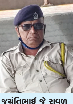
જયંતિભાઈ જે રાવળ ગીયોડ મંદિર