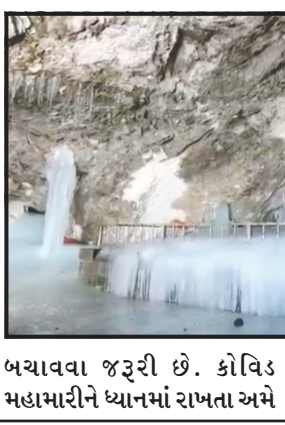
બચાવવા જરૂરી છે. કોવિડ ઉલ્લેખનીય છે કે વર્ષ ૨૦૨૦માં મહામારીને કારણે

આયોજિત કરવાનો નિર્ણય કરશે, પરંતુ સાથે તે પણ સ્પષ્ટ કર્યું હતું કે લોકોના જીવ બચાવવા તેમની સર્વોચ્ચ પ્રાથમિકતા છે. હિમાલયના ઉચાઈ વાળા ભાગમાં ૩૮૮૦ મીટર ઉચાઈ પર સ્થિત ભગવાન શિવના ગુફા મંદિર માટે ૫૬ દિવસથી યાત્રા ૨૮ જૂનના પહલગામ અને બાલટાલ માર્ગોથી શરૂ થવાની હતી અને આ યાત્રા ૨૨ ઓગસ્ટે સમાપ્ત થવાની હતી. તે પછીથી ૨૨ જૂનના અમરનાથ તીર્થયાત્રા થશે, સિન્હાએ અહીં સંવાદદાતાઓને કહ્યું- હું પહેલા