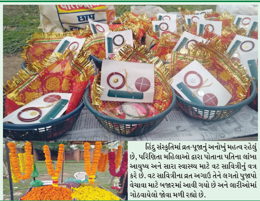
હિંદુ સંસ્કૃતિમાં વ્રત-પૂજાનું અનોખું મહત્વ રહેલું છે, પરિણિતા મહિલાઓ દ્વારા પોતાના પતિના લાંબા આયુષ્ય અને સારા સ્વાસ્થ્ય માટે વ્રત સાવિત્રીનું વ્રત કરે છે. વ્રત સાવિત્રીના વ્રત અર્પણ ઉત્સવને લગતો પુજાનો વેચાવા માટે બજારમાં આવી ગયો છે અને લારીઓમાં ગોઠવાયેલો જોવા મળી રહ્યો છે.