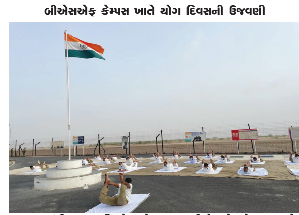
ગાંધીનગરના ચિલોડા રોડ પરના બીએસએફ કેમ્પસ ખાતે ગુજરાત ફિટ્નેસ એકમ દ્વારા વિશ્વ યોગ દિવસની ઉજવણી કરવામાં આવી હતી. જેમાં આઈજી જી.એસ. મલિક સહિત અધિકારીઓ અને સીમા સુરક્ષા કર્મીઓ જોડાયાં હતા. આ ઉપરાંત ‘બાવા’ દ્વારા પ્રહરી સંગીતીઓ પણ પોતાના ઘરે યોગ કરીને ઉજવણીમાં જોડાઈ હતી. બીએસએફના ગુજરાત ફિટ્નેસ હસ્તકની તમામ ચોકીઓ પર પણ યોગ દિવસની ઉજવણીનું આયોજન કરવામાં આવ્યું હતું.

બીએસએફ યોગ દિવસની ઉજવણી ‘યોગ એ આપણી સંસ્કૃતિની ધરોહર છે’ યોગસેવક શીશુપાલજીનું સ્વપ્ન છે કે ‘‘બસ હવે એક જ વાત યોગમય બનશે