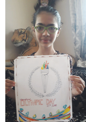
રસ દાખવે તથા રમત ગમત એ માનવ જીવનનું અભિન્ન અંગ છે તે સમજાવવાનો છે.

ગાંધીનગર, તા. ૨૩ દર વર્ષે ૨૩ મી જૂનને 'આંતરરાષ્ટ્રિય ઓલમ્પીક ડે' તરીકે ઉજવવામાં આવે છે. હાલ ભારતમાં પણ દર વર્ષે ખેલનું મહત્વ વધી રહ્યું છે. ૧૯૮૪ માં આંતરરાષ્ટ્રિય ઓલમ્પિક કમિટી બનાવવામાં આવી. જેનો ઉદ્દેશ વધારેને વધારે લોકો રમત ગમત-ઓલમ્પિક માં