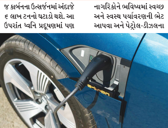
ખૂબ ઘટાડો થશે. રાજ્ય સરકારે રાજ્યના વાહનો પર ભારણ ઘટાડા ઈ-વ્હિકલ એટલે કે

સરકારે ભારે સબસીડીની જાહેરાત કરી હોવાથી આ પોલિસી આમ જનતા માટે આકર્ષક બની રહી છે. આગામી સમય ઈલેક્ટ્રીક વાહનોનો છે. ઈવી વાહનોનું વૈશ્વિક માર્કેટ જે રીતે આગળ વધી રહ્યું છે તે જોતા આગામી દાયકા ઈલેક્ટ્રીક વાહનોનો છે તેમાં કોઈ બેમત નથી. હાલના સમયમાં પર્યાવરણ બચાવવાની જે જરૂરીયાત ઉભી થઈ છે તેમાં ઈલેક્ટ્રીક વાહનો ખૂબ મદદરૂપ બની શકે છે. ઈ-વ્હિકલના કારણે માત્ર ગુજરાત રાજ્યમાં