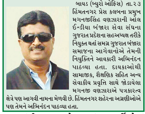
મગે તે પછ આગવી નામના મેળવી છે. હિંમતનગર શહેરના અગ્રણીઓએ પણ તેમને અભિનંદન પાઠવ્યા હતા.