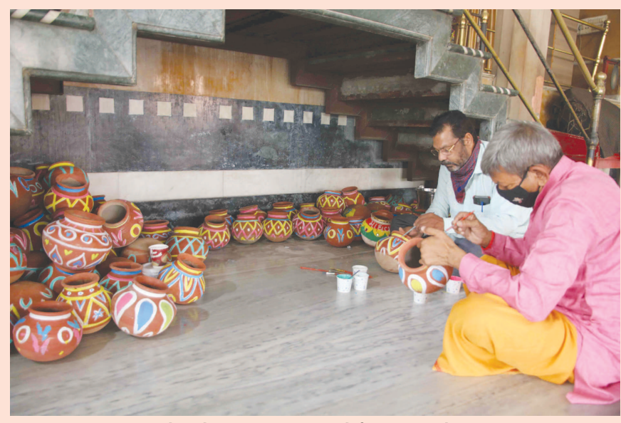
અમદાવાદમાં ભક્તોની જેમની આતુરતાથી રાહ જોઈ રહ્યા હતા, તેવી ભગવાન જગન્નાથજીની રથયાત્રા પૂર્વ નીકળતી જળયાત્રા આવતીકાલે નીકળવા જઈ રહી છે. ભગવાન જગન્નાથ, ભાઈ ભલરામ અને બહેન સુભદ્રાના રથને જળાભિષેક કરવાની વિધિ માટે સાબરમતી નદીમાંથી જળ લાવવા માટે આગામી તા. ૨૪મી જૂનના રોજ જગદીશ મંદિરથી જળયાત્રા માટે તૈયારીઓને આખરીઓપ આપી દેવામાં આવ્યો છે. અમદાવાદના જગન્નાથ મંદિરમાં ભીમ અગિયારસે ભક્તો દ્વારા માટલીઓને શણગારવામાં આવી હતી.

૨૦૧૯ની લોકસભા ચૂંટણીના પ્રચાર માટે કણાટકના કોલારમાં રાહુલ ગાંધીની એક રેલીનું આયોજન કરવામાં આવ્યું હતું. આ રેલીમાં રાહુલ ગાંધીએ કહ્યું હતું, નિરવ મોદી, લલિત મોદી, નરેન્દ્ર મોદી દરેકને મોદી અટક કેમ હોય છે. આ નિવેદન બાદ ભાજપના ધારાસભ્યએ રાહુલ ગાંધી સામે ફરિયાદ નોંધાવી હતી અને કહ્યું હતું કે રાહુલ ગાંધીએ મોદી શાતિનું અપમાન કર્યું છે. રાહુલ ગાંધીના આ નિવેદન પર વિવાદ થયો હતો.