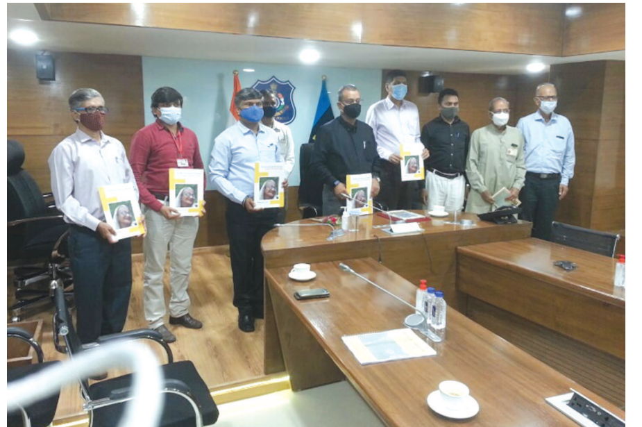
હેલ્થ એજ ઈન્ડિયા દ્વારા તૈયાર કરેલ અભ્યાસના અહેવાલનું વિમોચન વર્લ્ડ એલ્ડર એબુલ અવેરનેસ ડે ઉપર હેલ્થ એજ ઈન્ડિયા દ્વારા વડીલો પર થતા અભ્યાસો પર સમાજનું ધ્યાન અને કોરોના વાઈરસને કારણે વડીલો પર પડેલ અસરોનો હેલ્થ એજ ઈન્ડિયા દ્વારા તૈયાર કરેલ અભ્યાસના અહેવાલનું વિમોચન ગુજરાત રાજ્યના પોલીસ વડા આશિષ ભાટીયા દ્વારા કરવામાં આવ્યું. આ કાર્યક્રમમાં સિનિયર સિટીઝન પ્રતિનિધિના પ્રતિનિધિ અને પી.એલ.વી. જયરામભાઈ સોનીએ હાજરી આપી હતી.