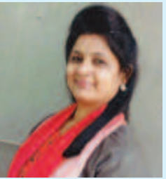
પરમજીત કૌર છાબડા નિયામક, અલ્પસંચયક બાંધા અને વિકાસ નિગમ ઉપમુખ્ય, ગાંધીનગર ભાજપ