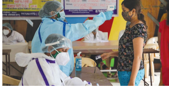
રસીકરણ છતાં કોઈ પણ પ્રકારે રાજ્યમાં કોરોના કાબુમાં નથી આવી રહ્યો. રાજ્યમાં છેલ્લા ૨૪ કલાકમાં ૧૨,૮૨૦ નવા કોરોના કેસ નોંધાયા છે. તો

ગાંધીનગર, તા. ૩ રાજ્યમાં કોરોના મહામારીએ હાહાકાર મચાવ્યો છે. રાજ્યના લોકો માટે સતત ત્રીજા દિવસે રાહતના સમાચાર છે. રાજ્યમાં કોરોના વાયરસના કેસમાં મોટો ઘટાડો થયો છે. રાજ્યમાં છેલ્લા ૨૪ કલાકમાં ૧૨ હજારથી વધુ કોરોનાના કેસો નોંધાયા છે. તો બીજી તરફ મોતનો આંકડામાં પણ ઘટાડો જોવા મળી શકે છે. ચાર મહાનગરોમાં પણ હવે કોરોનાના નવા કેસમાં સામાન્ય ઘટાડો જોવા મળી રહ્યો છે.